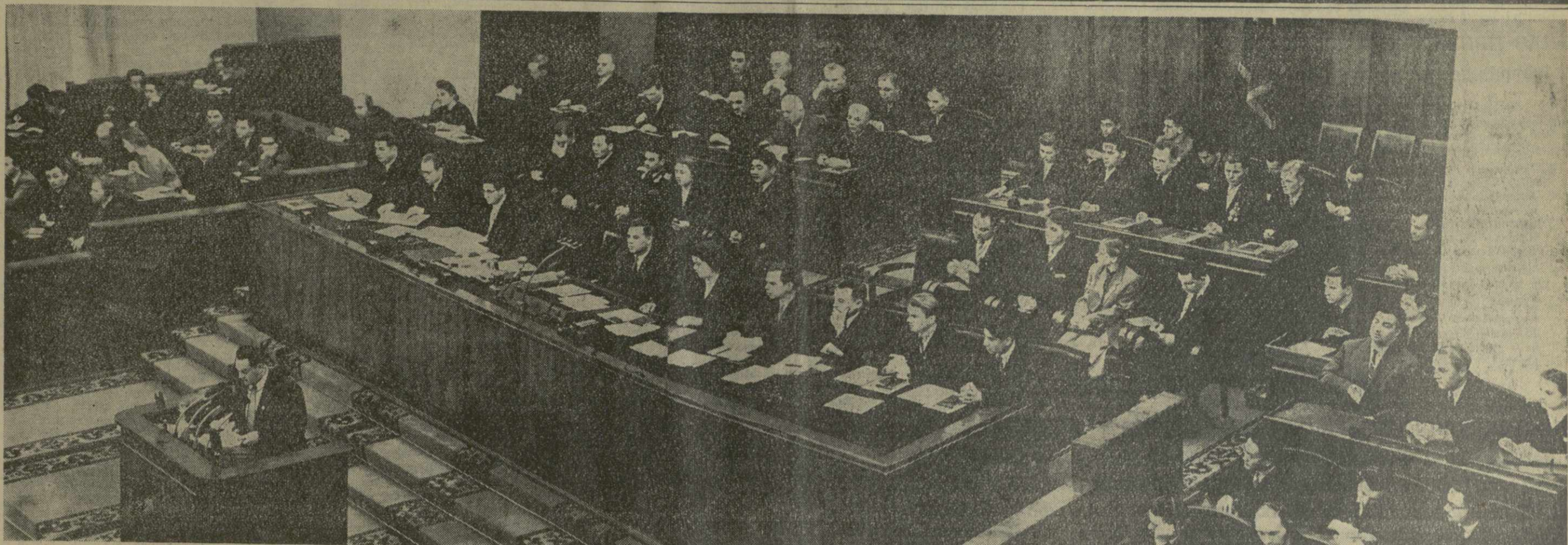
Москва. Президиум XIII съезда ВЛКСМ. На трибуне — первый секретарь ЦК ВЛКСМ А. Н. Шелепин.

(Из Призывов ЦК КПСС к 1 Мая 1958 года).