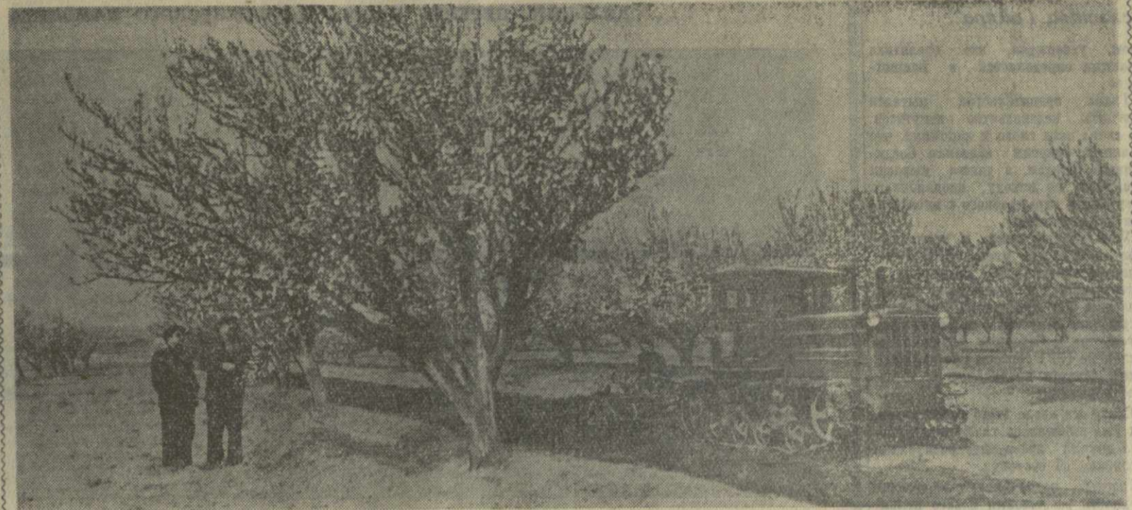
На снимке: весенняя обработка фруктового сада в Криванском совхозе Гареубанского района.