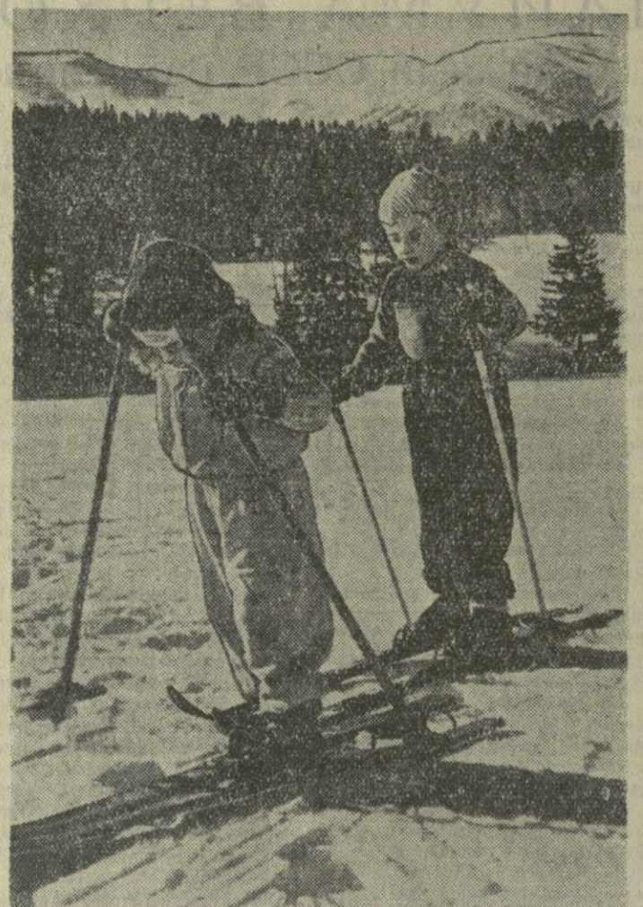
В Грузии пришла весна. Под лучами теплого южного солнца заехали слаймы в долину. А высоко в горах все еще лежит глубокий снег. Как приятно прогуляться на лыжах, чувствуя дыхание весны, чувствуя, что она уже близко, где-то там внизу, а полых...

Председатель Президиума Верховного Совета СССР К. ВОРОШИЛОВ. Секретарь Президиума Верховного Совета СССР М. ГЕОРГАДЗЕ. Москва, Кремль 17 апреля 1958 г.