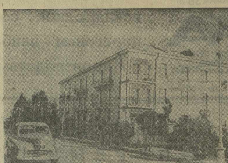
Сухуми. Новый жилой дом Министерства автомобильного транспорта на улице Сталина.