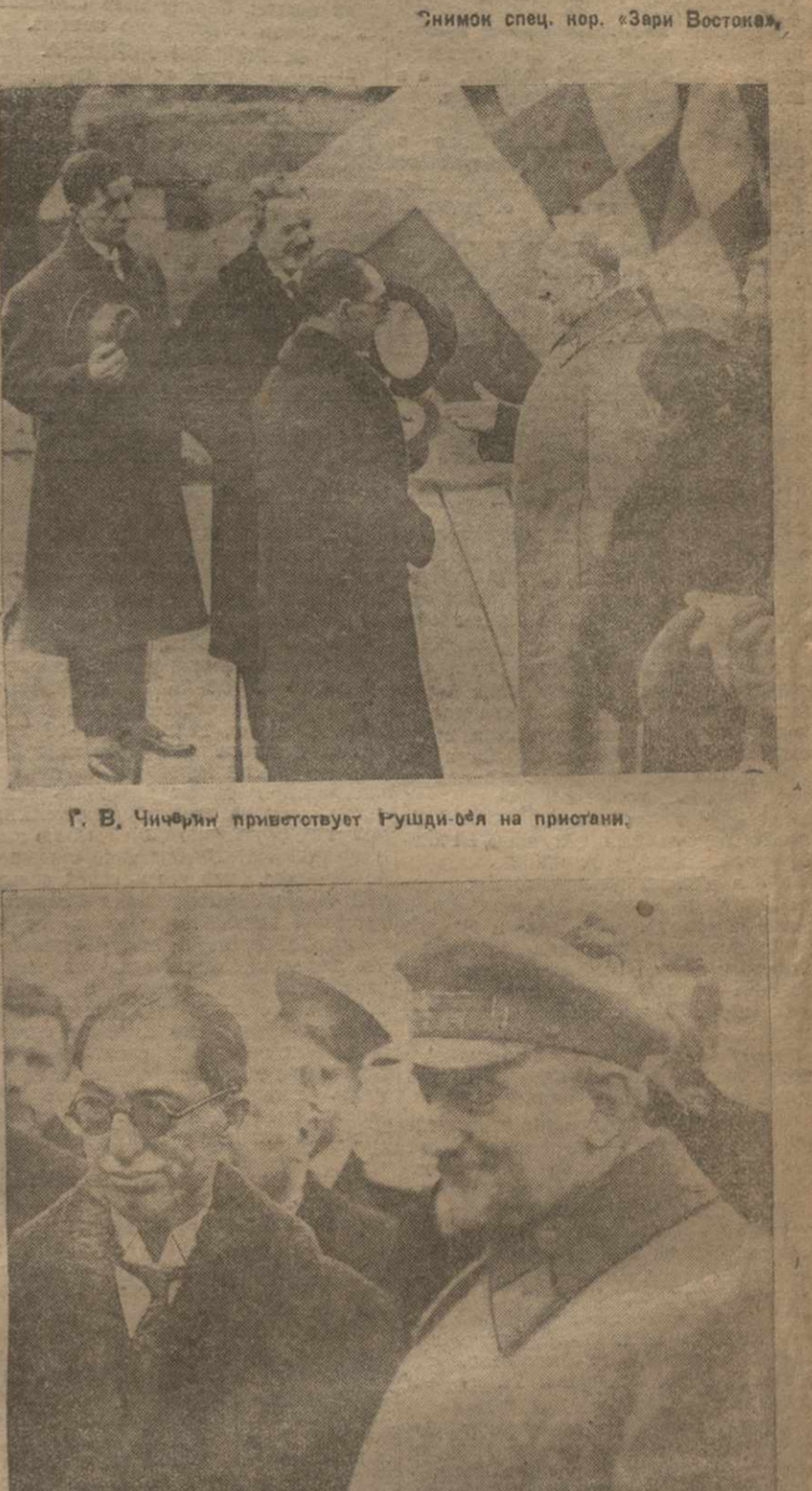
Свидание в Одессе. Эпимон спец. кор. «Зари Востока».