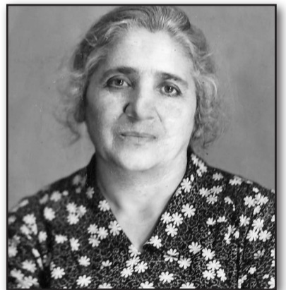
მინა ვხვდავდე შენს სათნო სახეს, შეიღებზე ფიქრით დაღალულ თვალებს, მაგრამ სიკვდილმა გეჯაჯობა, დედა, ასლა ვუმწერი გაეინულ სახეს.