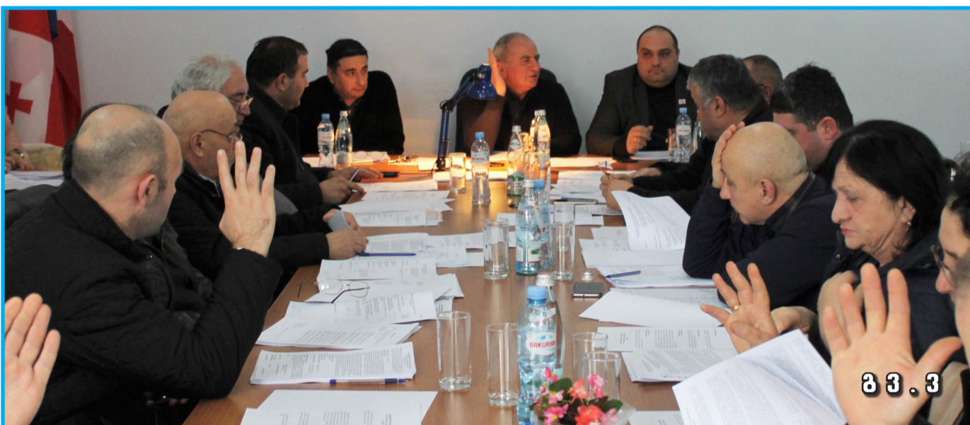
მ მ . 3

აუტიზმის სინდრომის მქონე ბავშვები დედოფლისწყაროში ერთჯერადად 500 ლარს მიიღებენ