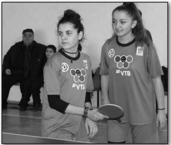
დასჯერდნენ. გამარჯვებული გუნდები მათში საქართველოს ჩემპიონატში მიიღებენ მონაწილეობას.

მაგდის ჩოგბურთში „საქართველოს სასკოლო ოლიმპიადის-2018-ის კახეთის ჩემპიონები თელავის გოგონათა და ვაჟთა გუნდები გახდნენ, დედოფლისწყაროელები კი მეორე ადგილებს