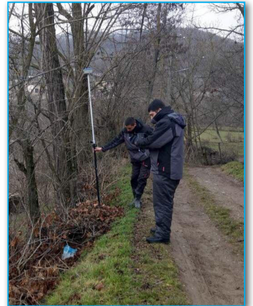
მ მ . 3