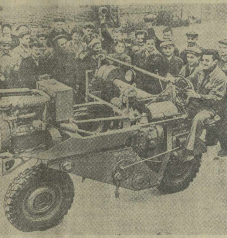
Машина предназначена для следующих операций: подрезки чайных кустов, культивации междурядий чая, зимней перекопки, внесения минеральных удобрений.

Эту машину с нетерпением ждут работники сельского хозяйства Грузии. Перед конструкторами была поставлена задача — устранить все выявленные в эксплуатации недостатки предыдущего образца.