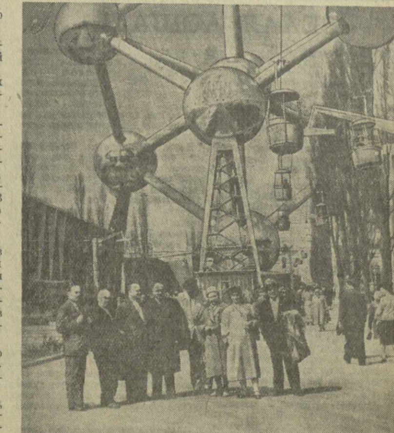
На снимке: На Брюссельской всемирной выставке. Высоко в небе вздымаются конструкции «Атомiums». Они видны с любого угла выставки.

и мысли, укрепил борьбу за мир во всем мире. 17 апреля в 11 часов по брюссельскому времени после торжественной церемонии выставка открылась. Щелкнули ножницы у дверей всех павильонов, ленточки упали на землю. Еще задолго до открытия советского павильона здесь собралась огромная толпа. Американцы, англичане, немцы, негры... рабочие, служащие, купцы, коммивояжеры, монахи, ученые плотным кольцом окружили стеклянные стены павильона. В их глазах любопытство, вопрос: что им покажет павильон страны Советов? И вот они уже под сводами из стекла и алюминия, под советской крышей. На весь павильон раздаются позывные сигналы советских спутников Земли. Обширные залы поглощают тысячи посетителей. Девушки в национальных костюмах демонстрируют экспонаты. Советский павильон открыт. «Мир и труд» — вот лозунг советского человека, о котором рассказывает в советском павильоне. Первый зал советского павильона, посвященный общественному и государственному устройству нашей страны, наглядно показывает, как советский народ управляет своим государством. Тысячи посетителей с глубоким интересом осматривают образцы первых в мире советских искусственных спутников Земли, макет-панорама атомной электростанции на 650 тысяч киловатт, большую модель атомного реактора «Ленин», спущенного на воду в Ленинграде, модели современных советских самолетов. Невозможно перечислить все, что размещено под стеклянными сводами советского павильона. Здесь и модели шахты, и буровая вышка, и кинотеатр, и произведения живописи и