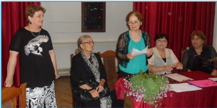
2018 წლის 23 მაისს მოსწავლე-ახალგაზრდობის სახლში ჩატარდა კალიგრაფიის კონკურსი „კალმოსანი“. მონაწილეობდნენ ქალაქ დედოფლისწყაროს 5 სკოლის 13

პირველკლასელი. კონკურსანტებმა კარნახით დანერეს ლილა ბაბადიშის ლექსის ერთი სტროფი.