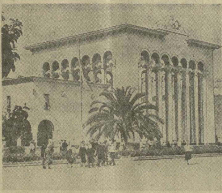
Москва. Павильон Грузинской ССР на Всесоюзной сельскохозяйственной выставке.

Сейчас закончена подготовка к приему гостей — отремонтировано здание павильона, расставлены стенды с многочисленными экспонатами. Бригада московских живописцев под руководством главного художника павильона В. Дугладзе красиво оформила павильон.