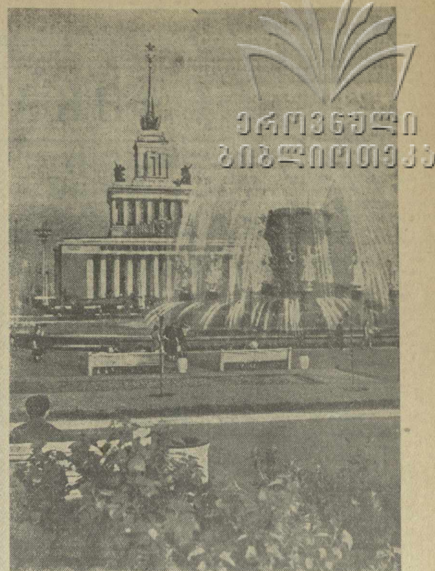
Москва. Всесоюзная сельскохозяйственная выставка 1958 года. На снимке: вид на фонтан «Дружба народов» и Главный павильон.