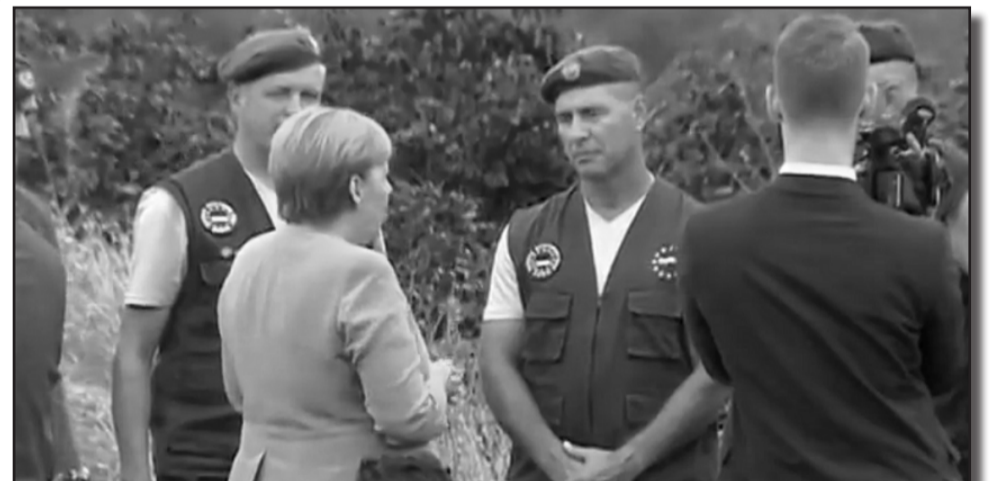
ანგელა მერკელმა საოკუპაციო ხაზთან ვიზიტის შემდეგ პირველად იხმარა სიტყვა „ოკუპაცია“. „კი, კი, ეს ოკუპირებული ტერიტორიებია... ცხადია... არ მეშინია, ვთქვა, რომ ეს არის (საქართველოს) 20 პროცენტის ოკუპაცია... მაგრამ, ამავე დროს, ეს დიდი უსამართლობაც არის“...

ფაქტია, რომ ბუქარესტული გამბიტის შემდეგ კანცლერს ქართულ პროდასავლურ პოლიტიკურ წრეებში მაინც-დამაინც პოზიტიური დამოკიდებულება არ ჩამოუყალიბდა. ამას, რა თქმა უნდა, ხმამაღლა არ აცხადებდნენ, მაგრამ მისდამი წყენა პოლიტიკური "სამზარეულოს" საუბრებში და კულუარებში ამკარად შეიმჩნეოდა. ყველა ფიქრობდა, რომ საქართველოს ალიანსში მიღების საკითხში სწორედ გერმანია ასრულებდა ნატოს წევრ-ქვეყნებში ნეგატიური ტონის მიმცემი ქვეყნის როლს. ამას ისიც