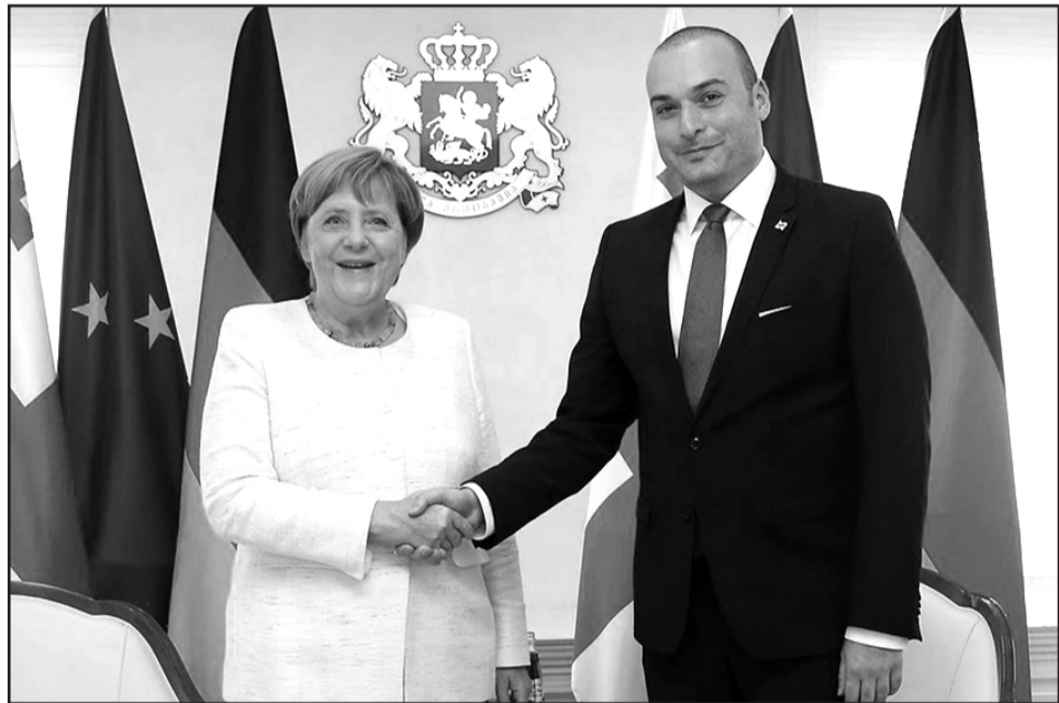
სახელმწიფოთა ურთიერთობებში ათი წელი ბევრი არაა, მაგრამ არც ისე ცოტაა, რომ მას მნიშვნელობა არ ჰქონდეს. ნათელია, რომ თანამედროვე დინამიური და იმავდროულად პრობლემური მსოფლიო პოლიტიკის გამო ქვეყნების ინტერესებში ბევრი რამ იცვლება ხოლმე, რაც ადრე მუდმივი და უცვლელი ჩანდა.

ოფიციალურად, ანგელა მერკელის საქართველოში ვიზიტის დროს აქცენტები იქნება დასმული რუსეთ-საქართველოს 2008 წლის ომის მეათე წლისთავსა და კონფლიქტის მშვიდობიან დარეგულირებაზე, საქართველოსთან დაკავშირებით ნატოს "ღია კარის პოლიტიკის" მხარდაჭერაზე, საქართველოს ეკონომიკური განვითარების მნიშვნელობაზე გერმანიასთან მიმართებით (4,5%-იანი ეკონომიკური ზრდის გათვალისწინებით), ლიბერალური საეიზო რეჟიმთან დაკავშირებულ პრობლემებზე და მსოფლიოში ცნობილ ფრანკფურტის წიგნის ბაზრობაში საქართველოს მონაწილეობაზე (საპატიო სტუმრის სტატუსით), თუმცა აშკარაა, რომ ჩამოთვლილი საკითხებიდან ჩვენთვის მაინც ყველაზე საინტერესო და მნიშვნელოვანია გერმანიის პოზიციის ცვლილება საქართველოს ნატოში გაწე-