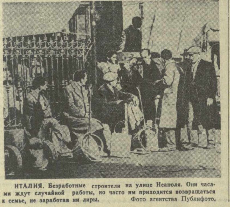
ИТАЛИЯ. Безработные строители на улице Неаполя. Они часами ждут случайной работы, но часто им приходится возвращаться к семье, не заработав ни лиры.

Участие Италии в НАТО не повысило и ее авторитета в международных делах. Напротив, выступление официальных представителей Италии свидетельствуют, что их позиция по важнейшим международным проблемам мало чем отличается от позиции госдепартамента США. Между тем совершенно очевидно, что Италия с ее 50-