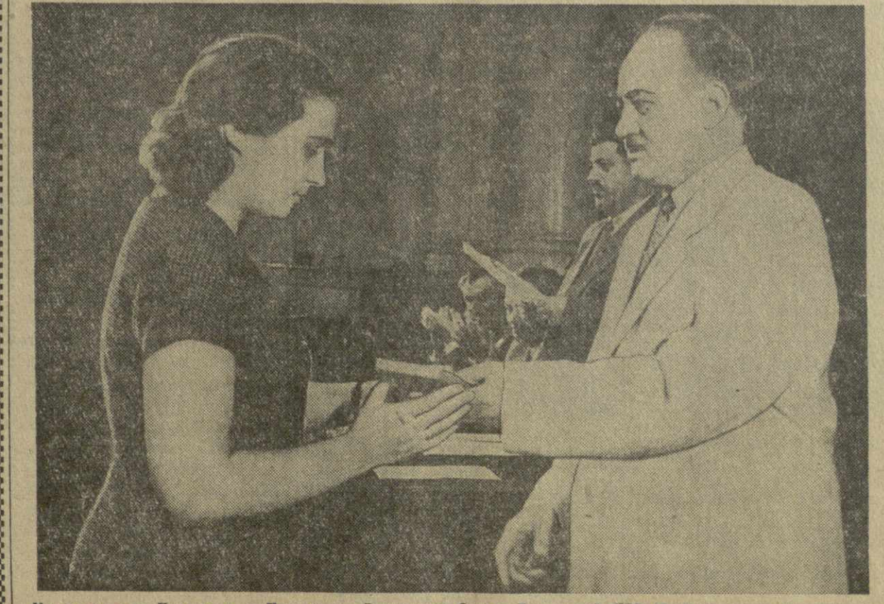
На снимке: Председатель Президиума Верховного Совета Грузинской ССР М. Чубинидзе вручает орден Президиума Верховного Совета СССР награду А. Каландадзе.

Молодой колхозник этой же артели Хути КАДАРИЯ, впервые собирающий чай, сдал 57 килограммов листа при норме 25 килограммов.