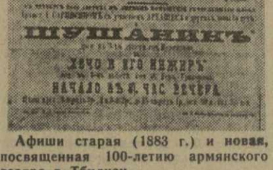
Афиша старая (1883 г.) и новая, посвященная 100-летию армянского театра в Тбилиси.