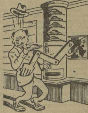
Автообсчет. Рис. Г. Ломидзе.

— Вывешивать бутерброды — не моя обязанность. Я — повар, временно заменила буфетчицу. Вскоре появились и буфетчицы — О. и Г. Мансурадзе. Оказалось, что они вместе ушли на перерыв, доверив свою работу недобросовестной сотруднице. В одном из бутербродов с икрой оказалось недоев в 40 граммов. Икры в бутерброде было на 10 граммов меньше, чем полагалось по норме. В закусочной-автомате не оказалось горячих закусок. Из 8 пивных автоматов в день проверки действовало только 6. Причина — отсутствие жетонов. В неприглядном виде предстала перед нами посудомойка. Посуда моется холодной водой, которую доставляют со двора.