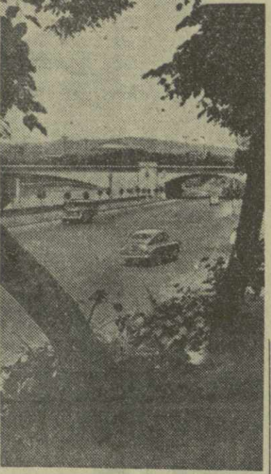
Мост имени Сталина (слева) и мост имени Бараташвили.

Архитектурный облик Тбилиси складывается не только из отдельных домов и целых ансамблей, но также из улиц, набережных и площадей, садов, парков и скверов. Неотъемлемой, органической частью архитектурного облика столицы Грузии являются и ее мосты. Они перекинуты через Куру на всем протяжении реки и границах города от Дидубе до Орчала. Любой из тбилисских мостов — не только сооружение для связи левого и правого берегов Куры, но и подлинное украшение города, а многие из мостов являются неповторимыми архитектурными памятниками старого и нового Тбилиси. Красавицы-мосты, сооруженные в годы советских пятилеток, — Дидубинский мост, мост имени Челюскинцев, мост имени Сталина, Метехский мост и ряд других полностью отвечают высоким требованиям сегодняшнего дня, соответствуют все возрастающим масштабам движения городского транспорта. Есть в столице и такой мост, который не встретишь, пожалуй, ни в одном другом городе нашей страны. Это мост-плотина Орчалавской гидроэлектростанции. Являясь по своей конструкции интереснейшим инженерным сооружением, Орчалавский мост-плотина, не только соединил оба берега Куры, но и изменил само течение реки. После возведения моста-плотины Кура уже не бьется в берега, как это было раньше, десятки и сотни лет назад. Умирная бетонная гора-плотина, река течет под мостами Тбилиси плавно и величаво, подстать телу, раскинувшегося на ее берегах. На снимках: мост имени Сталина (слева) и мост имени Бараташвили.