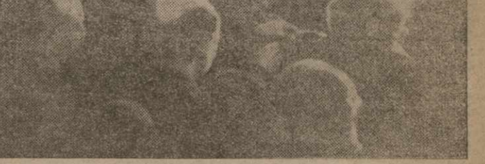
ПРИВЕТСТВИЯ СЪЕЗДА ПРОФСОЮЗОВ. Приветствие ЦИКа и Совнаркому ЦСУ СССР.

Москва, 7-го декабря (ЗТА). VII Всесоюзный съезд профсоюзов послал следующее приветствие ЦИКа и СНК СССР: