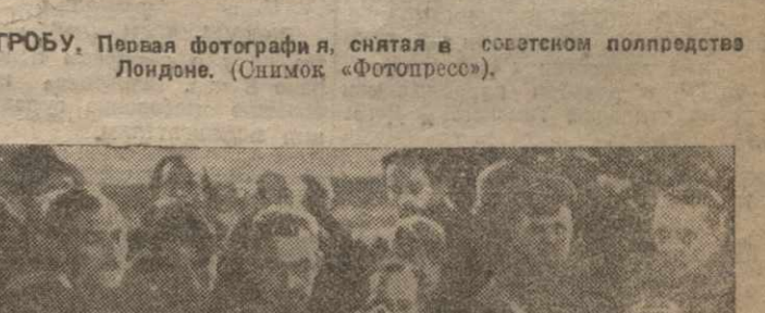
ПОХОРОНЫ Т. КРАСИНА В МОСКВЕ. Устаивка урна на катафалке на площади Александровского вокзала. Словом — член коллегии НКВД т. Гандейкин, жена и дочка Красина.