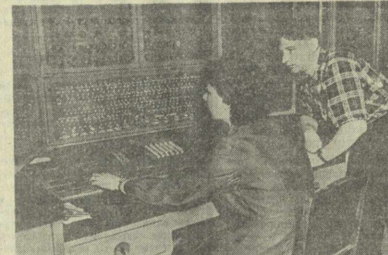
В вычислительном центре Академии наук СССР установлена и начала работать новая универсальная автоматическая цифровая вычислительная машина «Урал».

На вечернем заседании были заслушаны два научных доклада. На этом общем собрании Академии наук СССР закончилась работа. (ТАСС.)