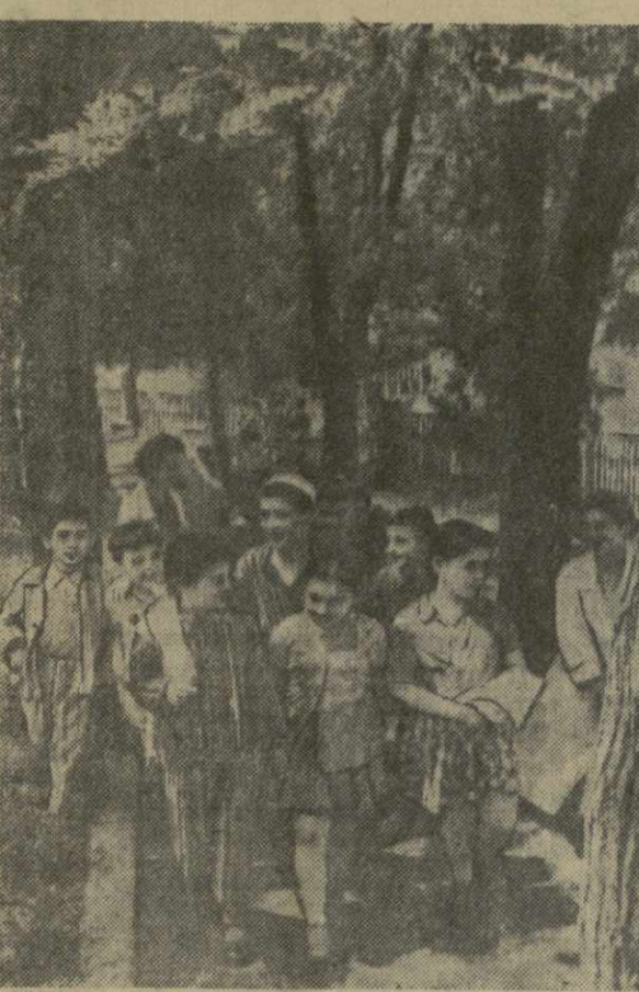
Ежегодно в ахтальском детском санатории отдыхают и направляют свое здоровье много детей трудящихся нашей страны. На снимке: юные отдыхающие ахтальского детского санатория возвращаются с ванны.

На курорте хорошо поставлена культурно-массовая работа, которой руководит опытный культработник Г. Манвелли. Часто проводятся вечера самодеятельности, познавательные экскурсии, лекции на международные, медицинские,