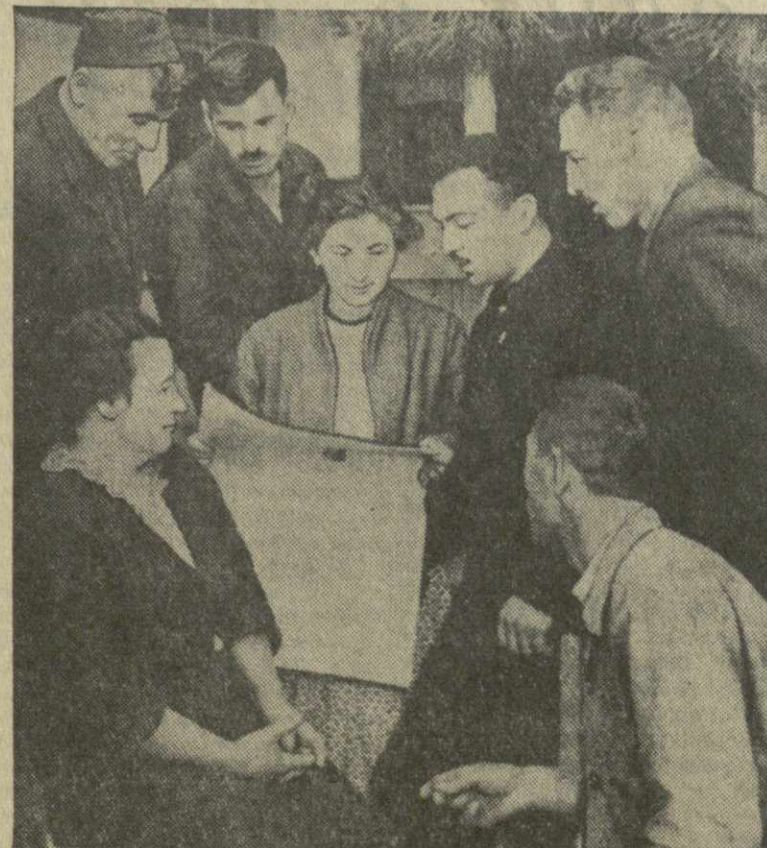
Во всех бригадах и звеньях колхоза «Сабчота Сакартвело» села Гладан Гареубанского района горячо обсуждается постановление июньского Пленума ЦК КПСС и доклад тов. Н. С. Хрущева «Об отмене обязательных поставок и натуроплаты за работы МТС, о новом порядке, ценах и условиях заготовок сельскохозяйственных продуктов».

Отдельные звенья и бригады взяли еще более высокие обязатель-