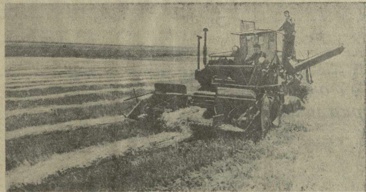
На снимке: самоходный комбайн СК-3 с подборщиком убирает скошенную пшеницу на полях колхоза «Сакартвело» Сагареджского района.

С. ХЕТАГУРИ. (Спец. корр. «Зари Востока»).