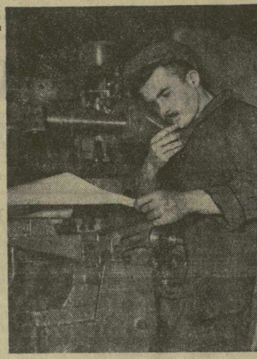
имени С. М. Кирова Шота Пирцхалава.

На снимке: новатор Тбилиского станкостроительного завода