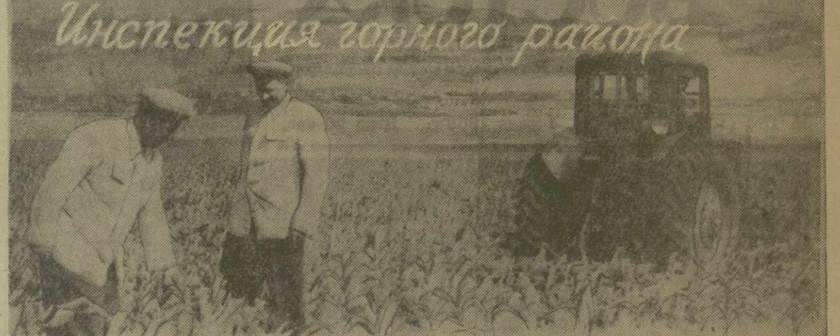
Инспекция горного района