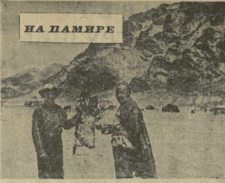
Этот снимок сделан на Памире, на высоте 4.700 метров над уровнем моря.

Проведению спартакиады в низовых коллективах физкультуры предшествовала значительная подготовительная работа.