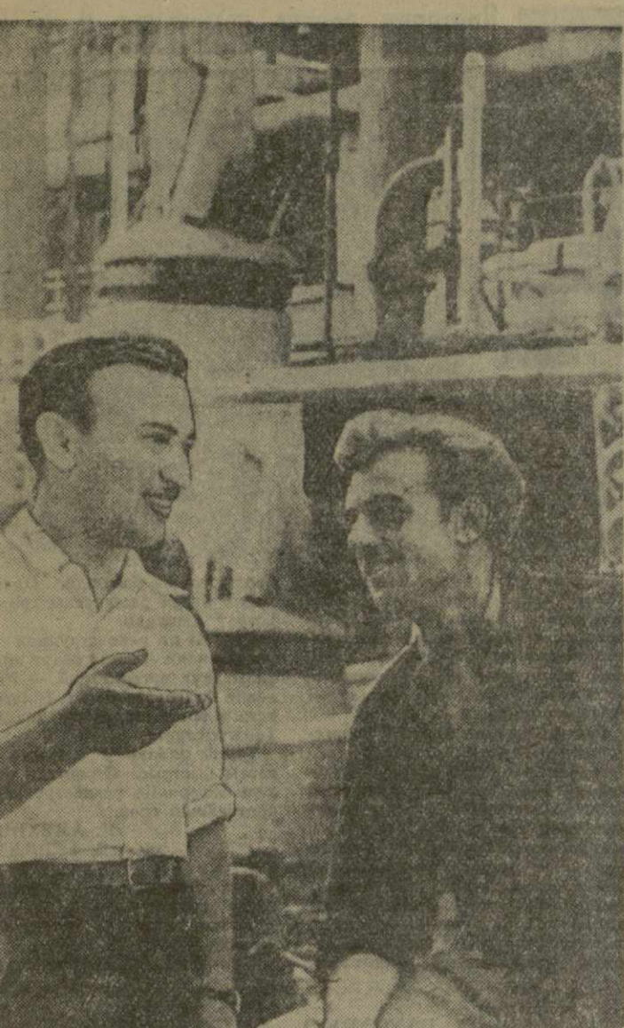
Руставский азотнотуковый завод. На снимке: передовики предприятия — старший начальник смены азотнотукового производства...