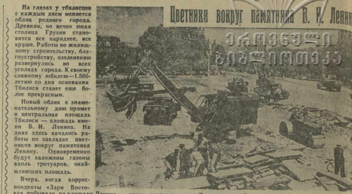
Цветники вокруг памятника В. И. Ленину