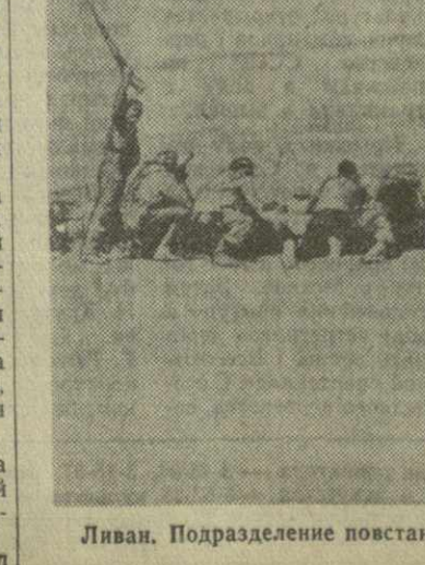
Ливан. Подразделение повстанцев в районе Аль Шуфа.

Большое развитие за последние годы получило в стране и здравоохранение. К. ЛОМТАТИДЗЕ, член-корреспондент Академии наук Грузинской ССР, депутат Верховного Совета СССР.