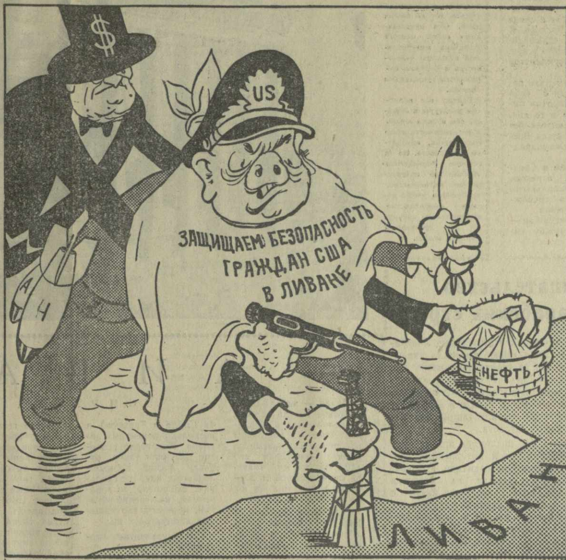
РУКИ ПРОЧЬ! Рис. Г. Ломидзе.

Митинг народного гнева и протеста против агрессии США состоялся на ереванском электромашинностроительном, шинном, алюминиевом заводах, Ленинакомбинате текстильного комбинате, во многих колхозах и совхозах республики.