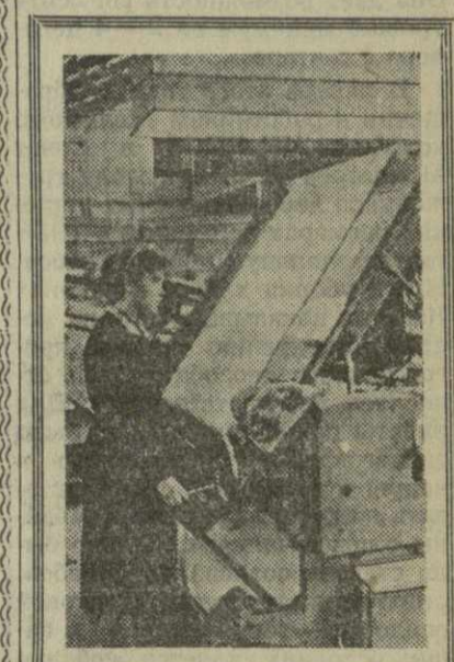
Московская область. На Наро-Фоминском приладно-ткацкой фабрике установлена бравоочная-учетная машина «БУ-2» выпуска 1955 года, изготовленная на Серпуховском механическом заводе. При помощи этой машины одновременно производится проверка качества ткани и измеряется количество метров в каждом куске. А с ним и к: бравоочная-учетная машина «БУ-2».