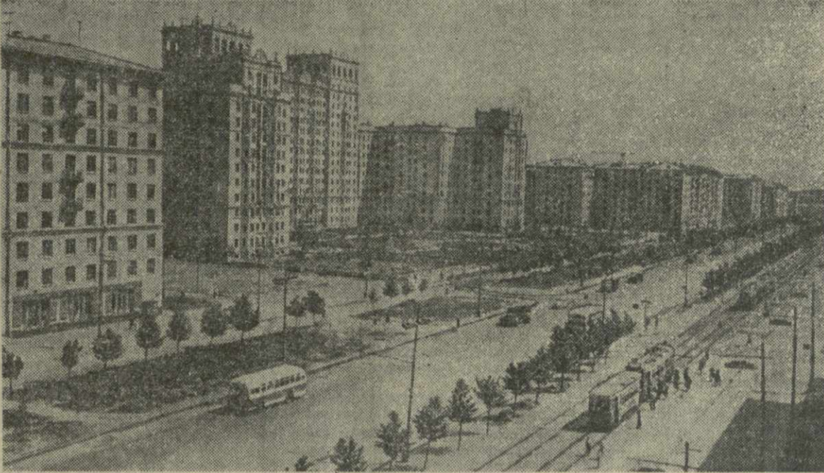
Москва. Ломоносовский проспект.

Быстро убрать хлеба без потерь, выполнить социалистические обязательства по увеличению производства зерна и других продуктов — патриотический долг всех тружеников сельского хозяйства.