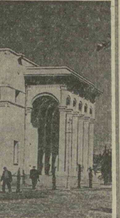
На снимке: здание Зугдидского драматического театра.

В. МИКАВА, секретарь комсомольского комитета трикотажной фабрики.