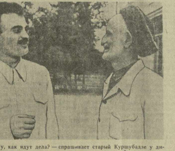
— Ну, как идут дела? — спрашивает старый Куршубазе у директора школы.