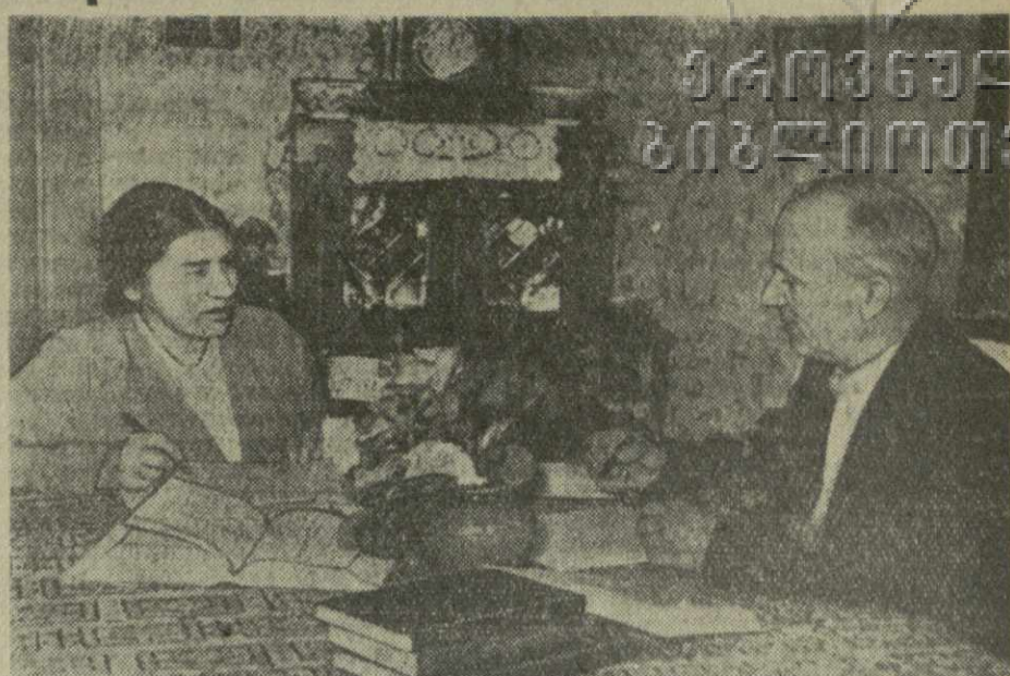
Тысячи километров отделяют Хэфэй от поселка на Черноморском побережье Грузии, но это не мешает китайским и советским ученым укреплять дружеские связи.