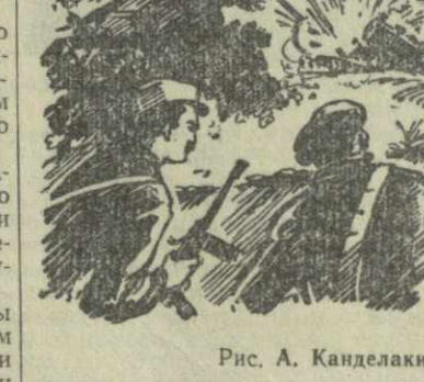
Рис. А. Кандекали.

Однажды, при ночной бомбежке, мы воспользовались паникой и бежали из лагеря через разрушен-