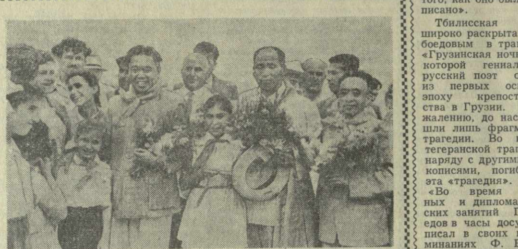
На снимке: руководящие работники связи Китайской Народной Республики на Тбилисском аэродроме.