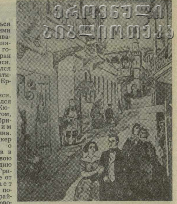
На снимке: репродукция с картин художника Р. Стура «Грибоедов на прогулке в Тбилиси».

Тбилиси в жизни и творчестве Грибоедова занимает исключительное место. 22 октября 1818 года Грибоедов впервые посетил Тбилиси. В то время он был назначен секретарем временного поверенного России в Иране и ехал к месту назначения. 28 января 1819 года Грибоедов направился в Иран, где он пробыл три года. В течение этого времени он несколько раз приезжал в Грузию. До нас дошел дневник Грибоедова, в котором он описывает путешествие в Тифлис в августе 1820 года. Как видно, Грибоедову очень трудно было жить в одиночестве в Иране. Не с