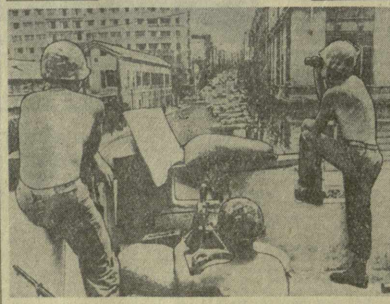
К событиям в Ливане. Огневая точка американских солдат на одной из улиц Бейрута.

ПАРИЖ, 14 августа. (ТАСС). Сегодня в Париже после тяжелой болезни в возрасте 58 лет скончался профессор Фредерик Жолио-Кюри, выдающийся французский ученый-физик и общественный деятель, лауреат международной Ленинской премии «За укрепление мира между народами».