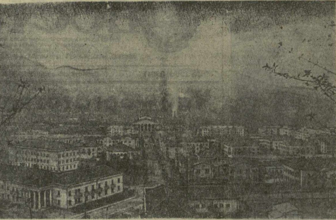
ПО ПРИЗЫВУ ТРУДЯЩИХСЯ КОБУЛЕТСКОГО РАЙОНА

СЕЛЬХОЗАРТЕЛЬ имени Шаумяна села Дранда Гулрышского района по плану должна была получить на каждую корову по 800 килограммов молока за год. Включившись в социалистическое соревнование, здешние животноводы надояли к 1 августа по 1.131 килограмму молока от коровы. Они обязались довести надой до 1.500 килограммов.