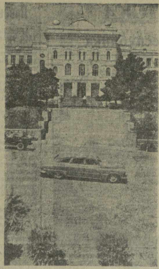
На снимке: вид на Государственный университет имени И. В. Сталина со стороны Варшавских.

Горячая пора сейчас у тбилисцев: они деятельно готовятся к 1500-летию родного города. Предпраздничный подъем царит и на Тбилисской шелкоткацкой фабрике.