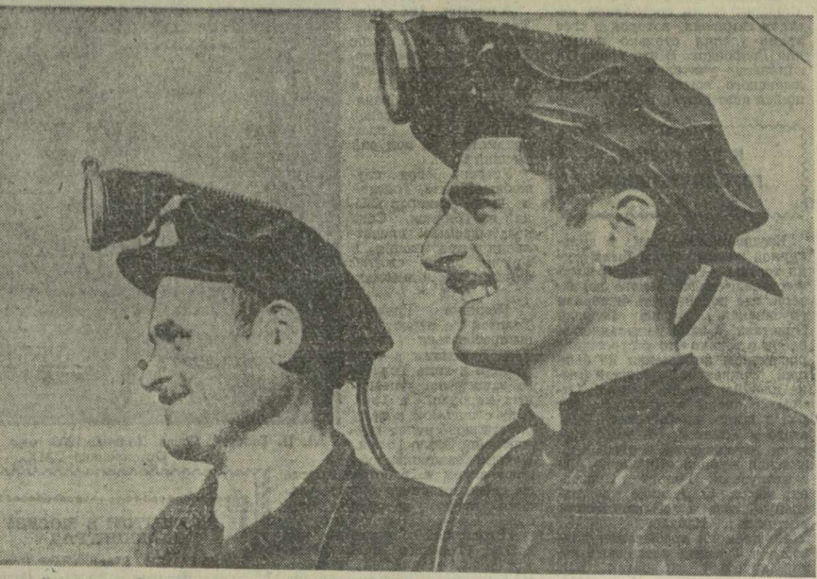
На шахтах Грузии широко развернуто соревнование в честь 41-й годовщины Великого Октября. Замечательных трудовых успехов добиваются молодые герои, которые в честь этой знаменательной даты ежемесячно выдают большое количество сверхпланового топлива.

Все эти факты, «изложенные в письме тресту «Грузхлебкондитер», казались бы, должны были