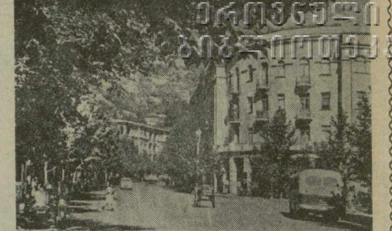
Читатура. Улица Ниношвили.