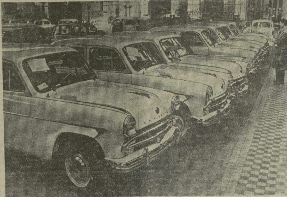
2.000 АВТОМОБИЛЕЙ „МОСКВИЧ“ СВЕРХ ПЛАНА В ПОДАРОК СЪЕЗДУ

Большое обязательство взяли на себя сборники Московского завода малолитражных автомобилей: дать в этом году в подарок предстоящему XXI съезду КПСС 2.000 сверхплановых автомобилей «Москвич». Коллектив предприятия сейчас напряженно борется за выполнение этого обязательства.