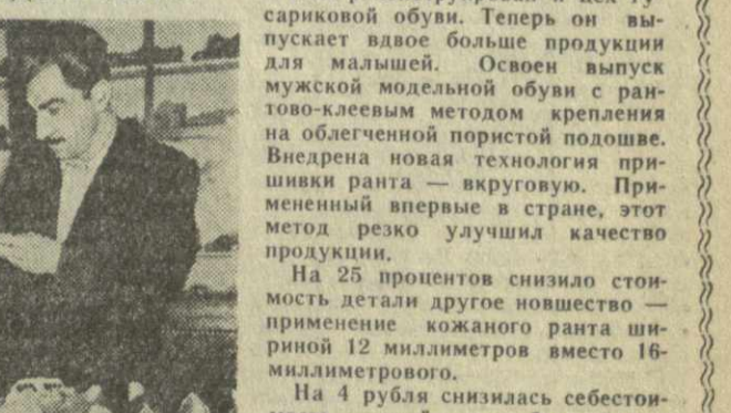
Большие сдвиги на пути совершенствования производства достигнуты на фабрике после XX съезда партии. Реконструкция двух конвейеров в цехе №1 позволила передать работу с механической работой к месту их запуска. Это помогло иметь в обороте для выполнения дневного плана вдвое меньше колодок, чем раньше, и выпускать за то же время на 300 пар обуви больше.

Был реконструирован и цех государственных обуви. Теперь он выпускает вдвое больше продукции для малышей. Освоен выпуск мужской модели обуви с рантов-клеяным методом крепления на облегченной пористой подошве. Внедрена новая технология пришивки ранта — круговой. Примененный впервые в стране, этот метод резко улучшил качество продукции. На 25 процентов снизилось количество деталей другое новшество — применение кожаного ранта шириной 12 миллиметров вместо 16-миллиметрового. На 4 рубля снизилась себестоимость каждой пары обуви, благодаря применению стелес как называемой искусственной губой. Недавно были подведены итоги соревнования между тбилискими обувниками и коллективом Московской обувной фабрики с «Парижская коммуна». Одновременно в Москве, на просмотре, были признаны отличными 8 новых моделей обуви с маркировкой фабрики №1. Всего же после XX съезда партии коллектив фабрики освоил 82 новых модели обуви. Полным ходом идет на фабрике реконструкция ведущего, штампочного цеха, готовящего детали низа обуви. Здесь строятся многолинейные конвейеры. После окончания работ производительность труда в цехе увеличится на 15 процентов. * * * На снимке: модельер Тбилисской обувной фабрики №1 Г. Гарибов за осмотром моделей мужской, женской и детской обуви, выпуск которых освоил коллектив предприятия после XX съезда КПСС.