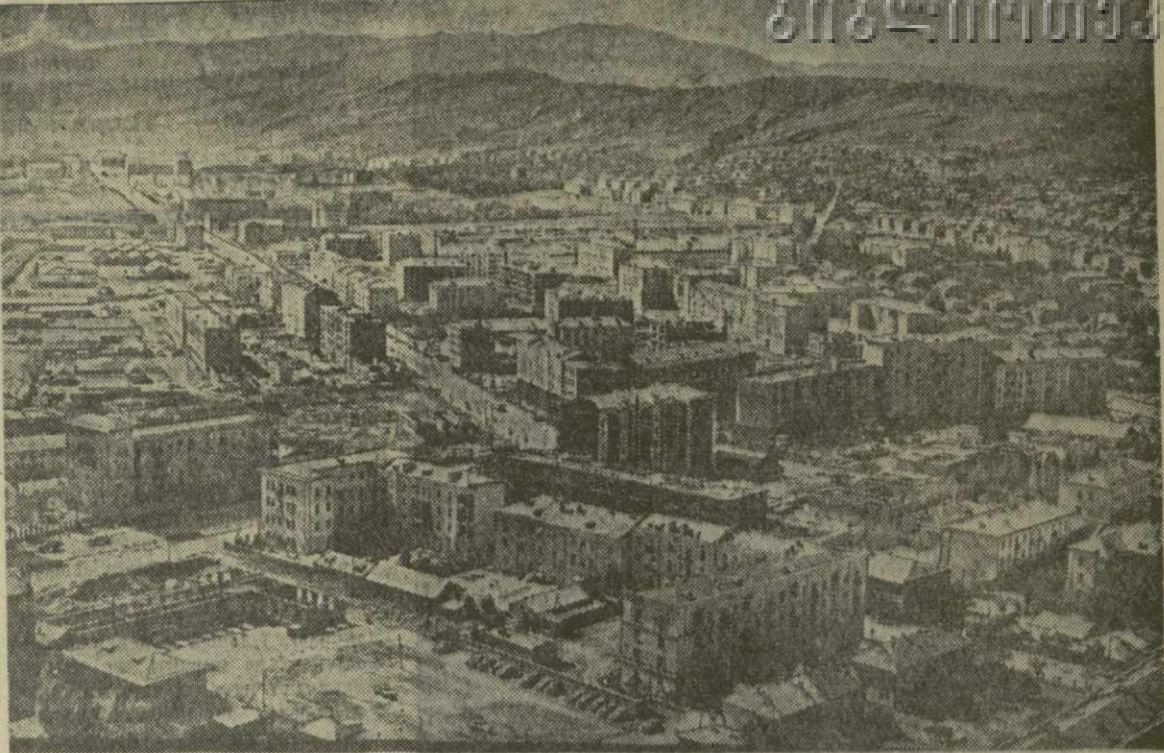
ПО ЗАЛАМ МУЗЕЕВ НАШЕГО ГОРОДА

Оценивая роль С. Шаумяна, начальник бакинского охранного от-