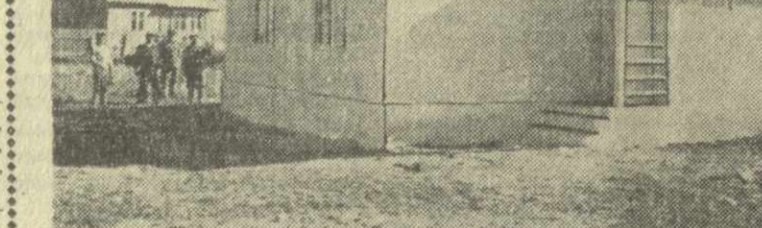
Дом за 8 дней.

Ваше внимание привлекает этот скромный дар. Дирижер сошел с эстрады долго-долго, совсем не по-жесткому тряс руку этого человека.