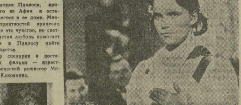
Скоро зрители увидят и первую серию новой картины производства Киевской киностудии имени А. Довженко «Киевлянка».

На снимках: кадры из фильмов (слева) «Девушка в черном» и «Киевлянка».