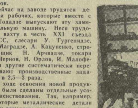
Тбилисская обувная фабрика №1 — это высокоавтоматизированное производство. За шесть месяцев 1958 года, по сравнению с тем же периодом 1955 года, фабрика выпустила на 19,2 процента обуви больше.