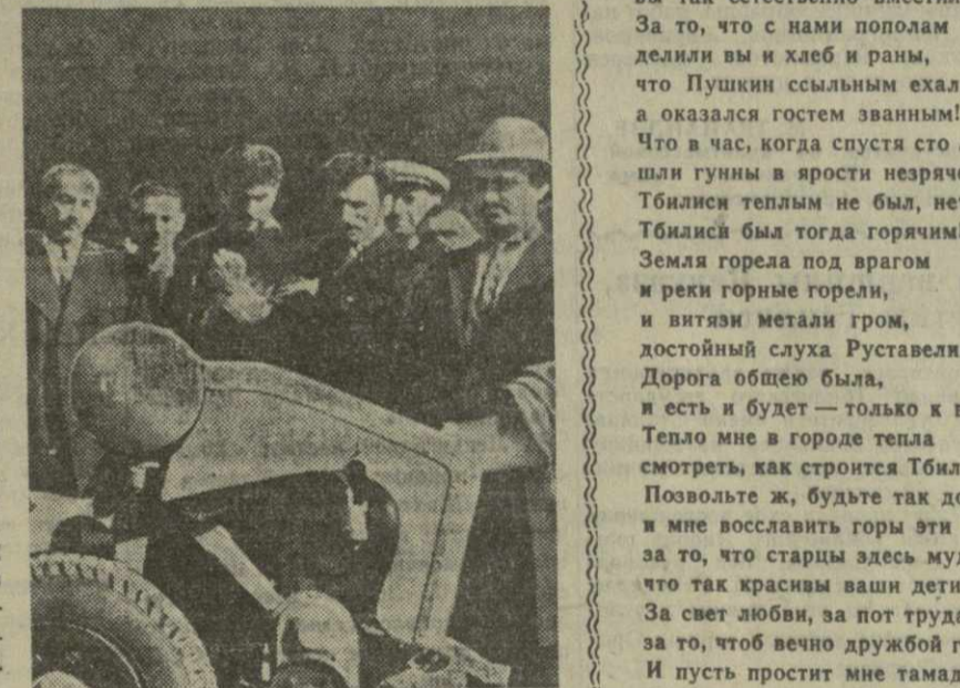
Снимки: 1. Общий вид Промышленной выставки, посвященной 1500-летию Тбилиси. 2. Трактор «Тбилиси», экспонируемый в павильоне машиностроения и электротехнической промышленности.