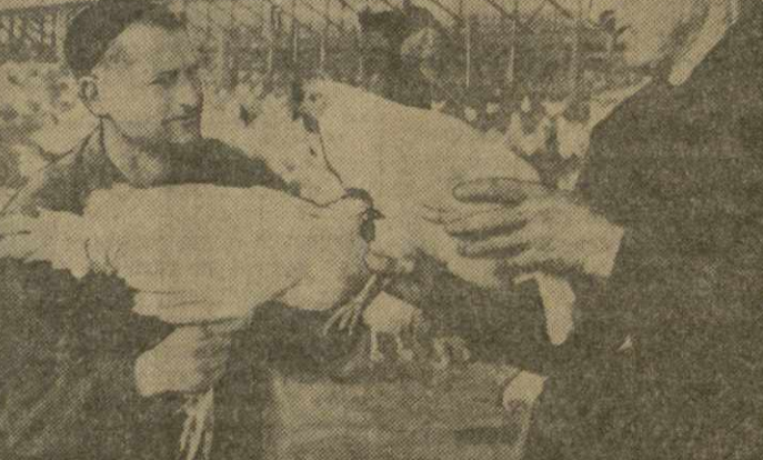
Птички поголовье быстро растут. Ферма, которая раньше ничего, кроме хлопот и убытка, не давала колхозу, теперь приносит доход. К 1 октября этого года от каждой несушки колхоз получил по 125 яиц. От реализации этой продукции в доход колхоза за 8 месяцев уже поступило 262,000 рублей.

Привет твоим шахтерам, металлургам, труженикам солнечных полей, Привет земле, которую прославил Шота бессмертной песней своей. Осетия тебя не забывает В порыве созидательном своем. Мы в честь твою свой toast произвожаем, Мы часто песни о тебе поем.