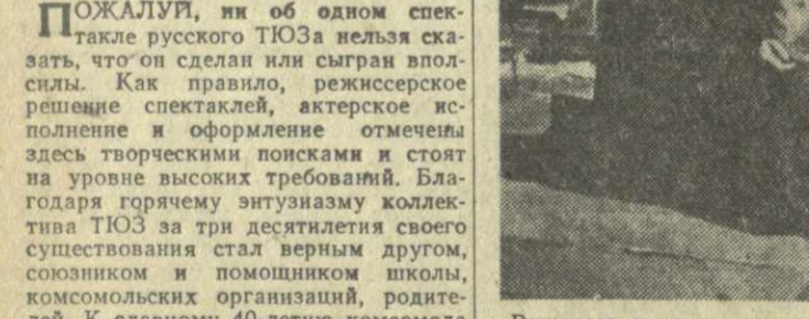
Региссер во многом углубляет и развивает замысел авторов пьесы. Так в зависимости от настроения той или иной картины голубой занавес ярко высветливается, то меркнет...