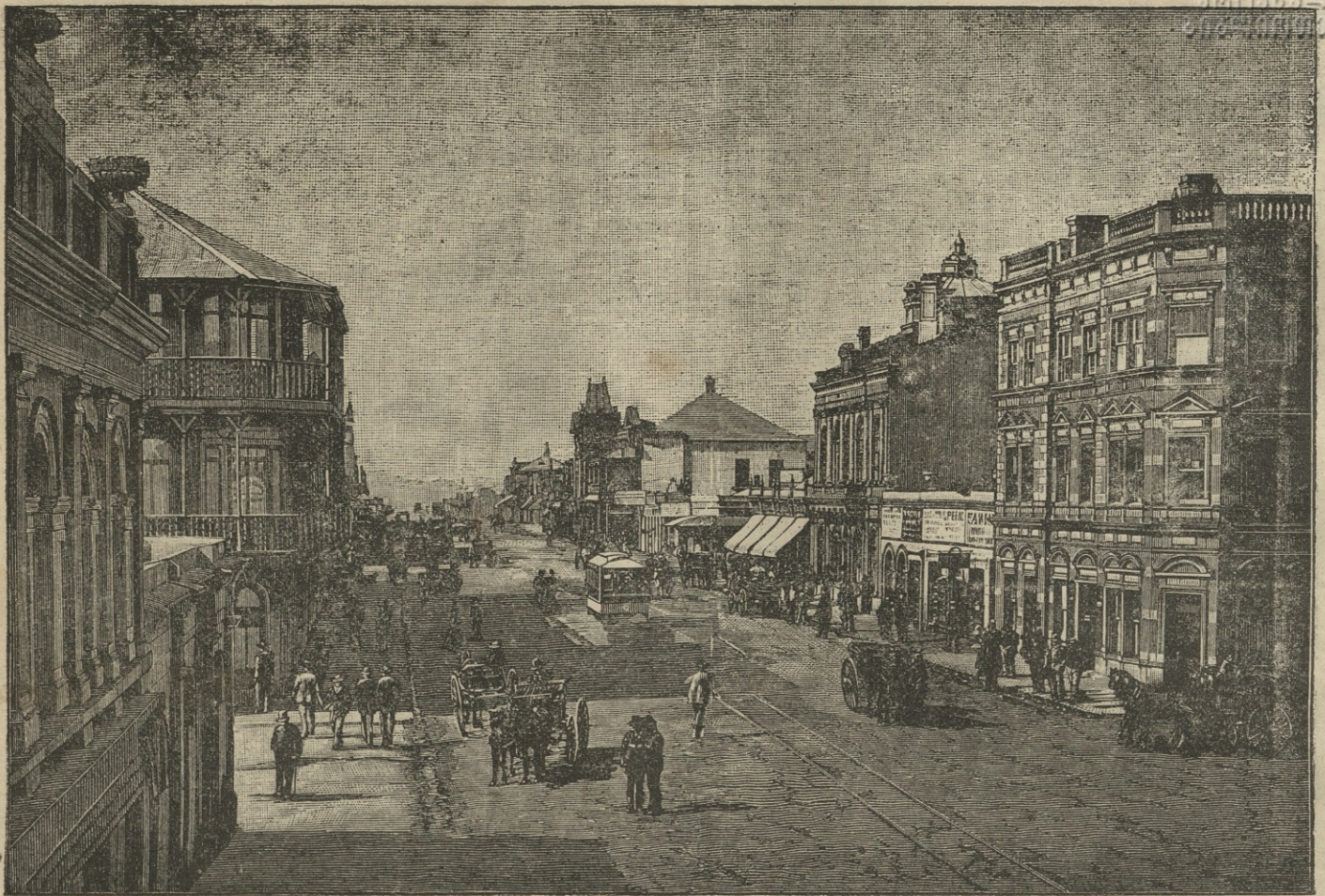
ტრანსვალის ქალაქი იოანსბურგი.

მდაზიის მეპატრონე, ქონებით ხელაძეზე „ბანდიდებუ- ლი“, მაგრამ გონებით კი... ის ვერ შეურიგდა ხელა- ძის „ნაბოლარობას“ და ხელსახნთა თავის სავარძელში წამოსკუბების სურვილმა, საჩივრებისათვის მოაკიდებია ხელი და როცა ამანაც ვერ გასჭრა, სრისკ მიმართა. 4 აპრილს, საღამოს 7 საათზე ის გაემურა სახელსნო გამკეობისაკენ და შესვლისათხავე, გამკეობის სტროფი სახლლის საყიდლოთ გავზავნა და ამ უადილო თადრი- გს შემდეგ მისგნით ათვალწუნებულ ფ. ხელაძეს მდეღვარების კილოთი გამოუცხადა: „მე შენგნით არა- ვითარ განხერტს არ ვღებულაბ და არც საჭიროთ ვრაცხ ამ გვარი ქადაღების მიღებაზე სტროფისაკან მოწო- დებულს დაუთარში ხელი ვაწერო“. დასასრულ ასეთი პროტესტისა რი პრისტაული სიღის ღაწახი ხდება დარბაზში და როგორც ბოქაულის არსებოების გამოკვე- ვისაკან ჩანს, ამ უმგანო საქციელის ჩადენაშიაც ხოჯა- შვილს ედება ბრალი. ბ. ხოჯაშვილს, სამართლის უკუღ- მა მობრუნების სურვილი აღძვრია არა მარტო იმ მოსაზ- რებით, რომ „გაღმა გადაკვებით, გამოღმა შეიწინოს“, არამედ იმ მოსაზრებითაც, რომ ხელაძეს არჩევნების მ- ნაწილეობის მიღებაშიაც უფლება ჩამოაფტქვნას და თვითონ ფონს მშვიდობიანთ გავიდეს, მაგრამ „ცუდით მოუხდა თათბირი და მისგან დასაბირება“. მოხელეებსა მალე შეი- ცნეს წელის ამმდურევი ვაჟბატონის „გულის ზრახვანი“ და ხელსახნთა თავის ასარჩევანთ კრება ჩქარა დანიშნეს. კრება შესდგა ხელაძის თავმჯდომარეობით ამა წლის 22 მარტს. სხვა განდიდატებთა შორის, თითქმის ერთ ხმევ დას-