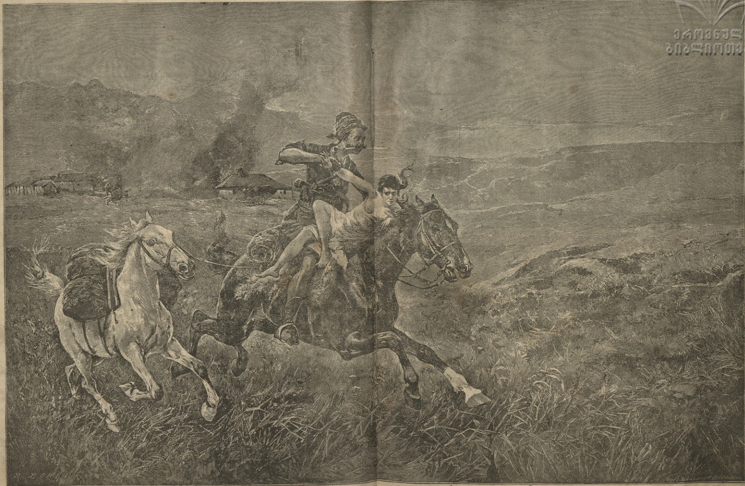
სომხის ქალის მარტვილის რუთებისგან აღმადგენა.