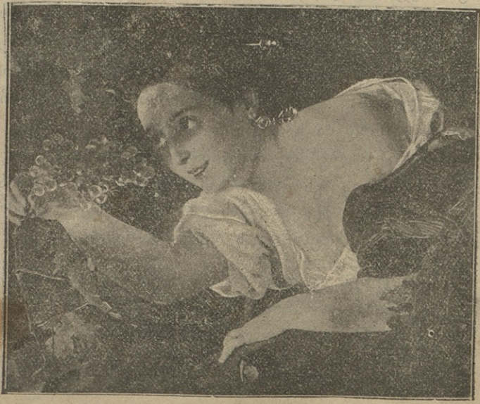
იტალიელი ქალი ყურძენს ჰკრებს.

ამდენ ხანს გასტანს ჩინეთის ომი, რა მოყვება მას, — აი უპირველესი კითხვები, რომლებიც გაისმის დღეს საზოგადოებაში ყოველგან: დიდი თუ პატარა, წარჩინებული პირი თუ უბრალო მომაკვდავი, შეგნებული თუ შეუგნებელი, ყველა ამ კითხვებს იძლევა, ყველას ვინტერესება მათზე მსჯელობა და პასუხის მიცემა. მართალია, ინგლის-ტრანსვაალის ომშიც დიდი ყურადღება მიიქცია, მაგრამ სულ სხვას წარმოადგენს დღევანდელი ომი ჩინეთში. ჩინეთის ამბებმა ორ ნაწილათ გაჰყვეს მთელი კაცობრიობა: ერთ მხარეზე დგას მარტო-მარტო ჩინეთი, რომელსაც არსაით მომხრე არაჰყავს, და მეორეზე — თითქმის მთელი დანარჩენი კაცობრიობა, თითქმის განგებ პირობა შეეკრათ პირველის წინააღმდეგ. მაგრამ ერთი კი ვიკითხოთ, თუ რა არის ჩინეთი?