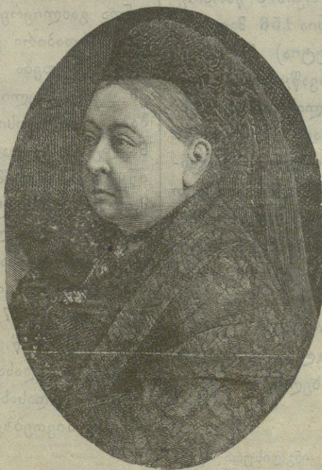
† ინგლისის დედოფალი ვიქტორია.

დამ თავის 9, ქ. ოსბორნში გარდაიცვალა ინგლისის დედოფალი ვიქტორია. არც ერთი გვირგვინოსანი გავლილი საუკუნისა იმდენ ხანს არ ყოფილა სამეფო ტახტზე, რამდენ ხანსაც ვიქტორია იყო. 18 წლის ვიქტორია, როგორც ერთათ-ერთი მემკვიდრე უშვილოთ გარდაცვალებულის ინგლისის მეფის ვილჰელმ მე-IV, გამეფდა 1837 წ. და მას შემდეგ სამეფოს უზენაესი გამგეობა ერთი დღითაც კი არავისთვის გადაუცია. ამ 63 წლის განმავლობაში ინგლისში ბევრნაირი მთავრობა გამოიკვალა: აქ იყო სამინისტრო კონსერვატიული, ლიბერალური, რადიკალური და სხ., მაგრამ არც ერთ შემთხვევაში დედოფალს თავისი ძალი არ უხმარია და ხალხის სურვილის წინააღმდეგ არ წასულა. რომელ პარტიასაც ხალხი მიანიჭებდა უმრავლესობას, ის იმ პარტიის მეთაურთ მო-