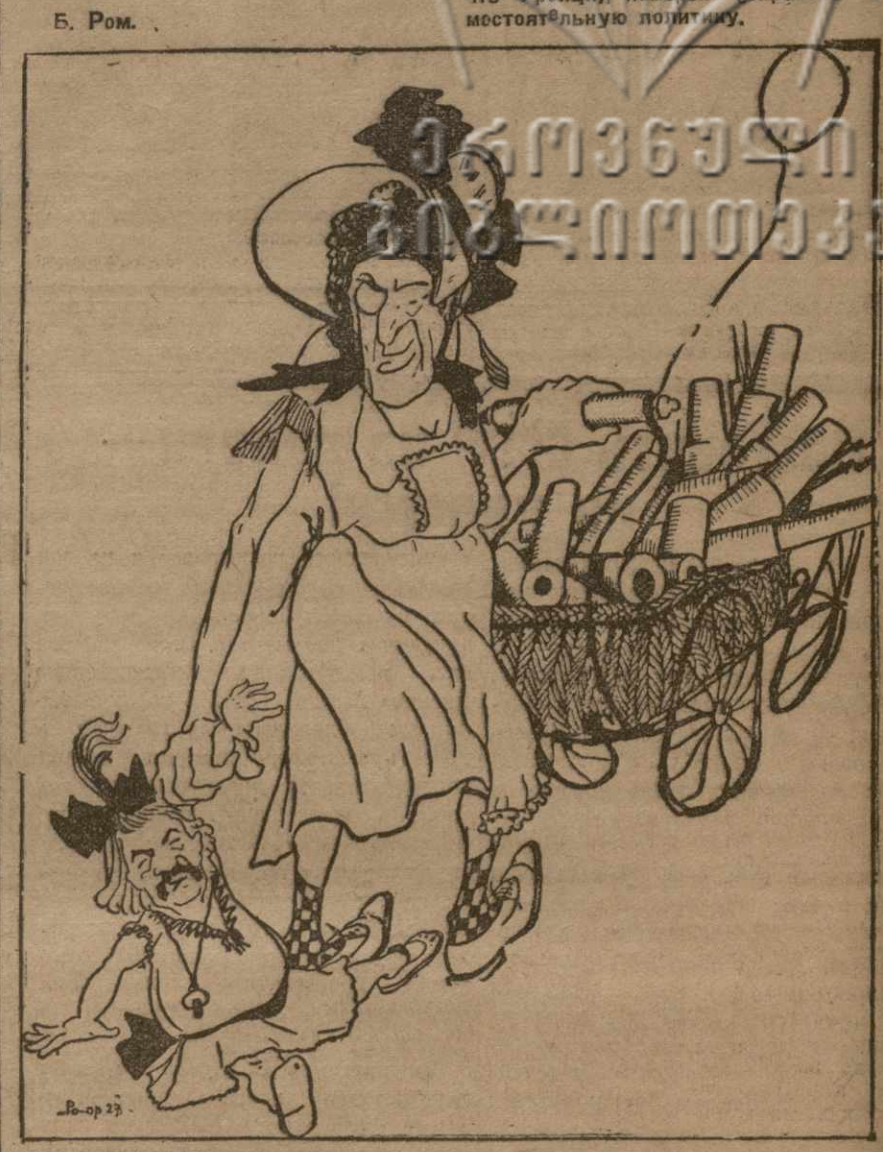
ЧЕМБЕРЛЕН. Ведь этакая скверная дочка! Я ей предлагаю такие великолепные игрушки, а она и не думает меня слушаться!