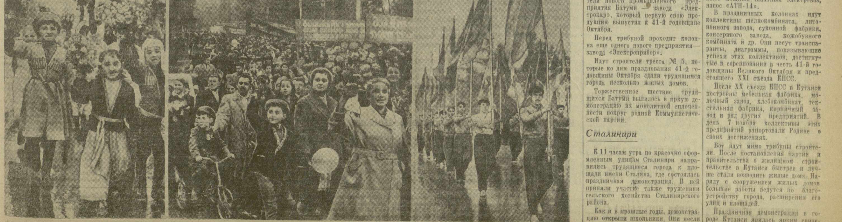
На снимках: демонстрация трудящихся города Тбилиси на проспекте Руставели 7 ноября 1958 года.

Как и в прошлые годы, демонстрацию открыли школьники. Они несли многочисленные плакаты, диаграммы, транспаранты, на которых показывали