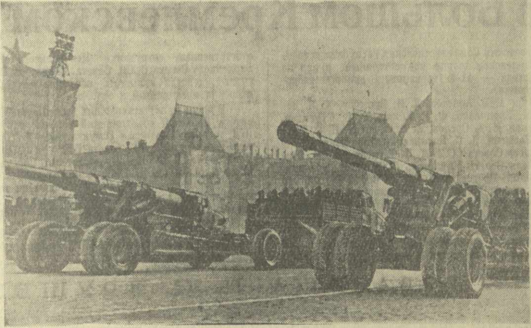
Москва, 7 ноября 1958 года. Празднование 41-й годовщины Великой Октябрьской социалистической революции. Парад войск Московского гарнизона. На с ним к: тяжелая артиллерия на Красной площади.