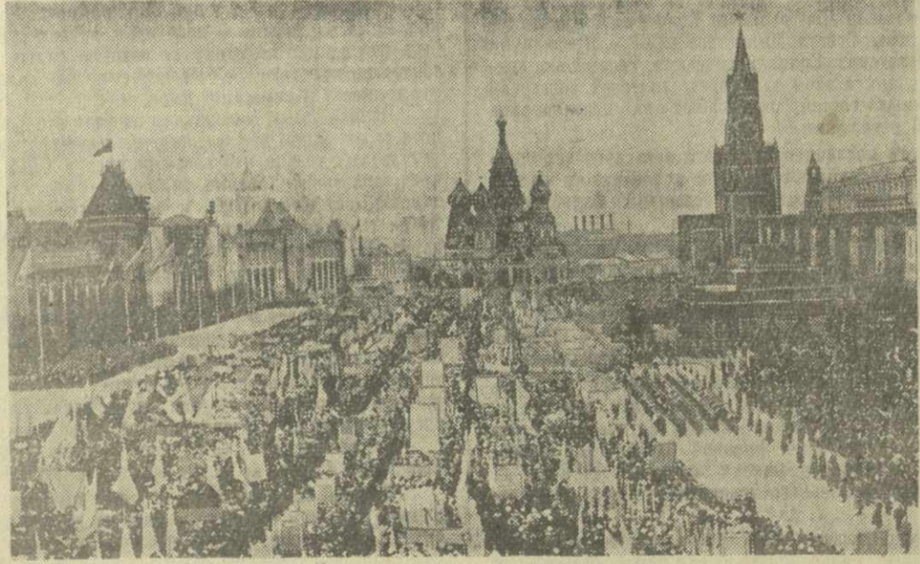
На снимке: демонстрация представителей трудящихся на Красной площади.

Идут авиамоделисты, планиристы, парашютисты. А вот новая волнующая картина. К Мавзолею приближается группа детей с цветками. Они валяются по лестнице вверх, и через мгновенные головки ребят показываются на трибуну. Ласково встречены, под дружные аплодисменты, юные москвичи дарят букеты живых цветов руководителям партии и правительства, гостям.