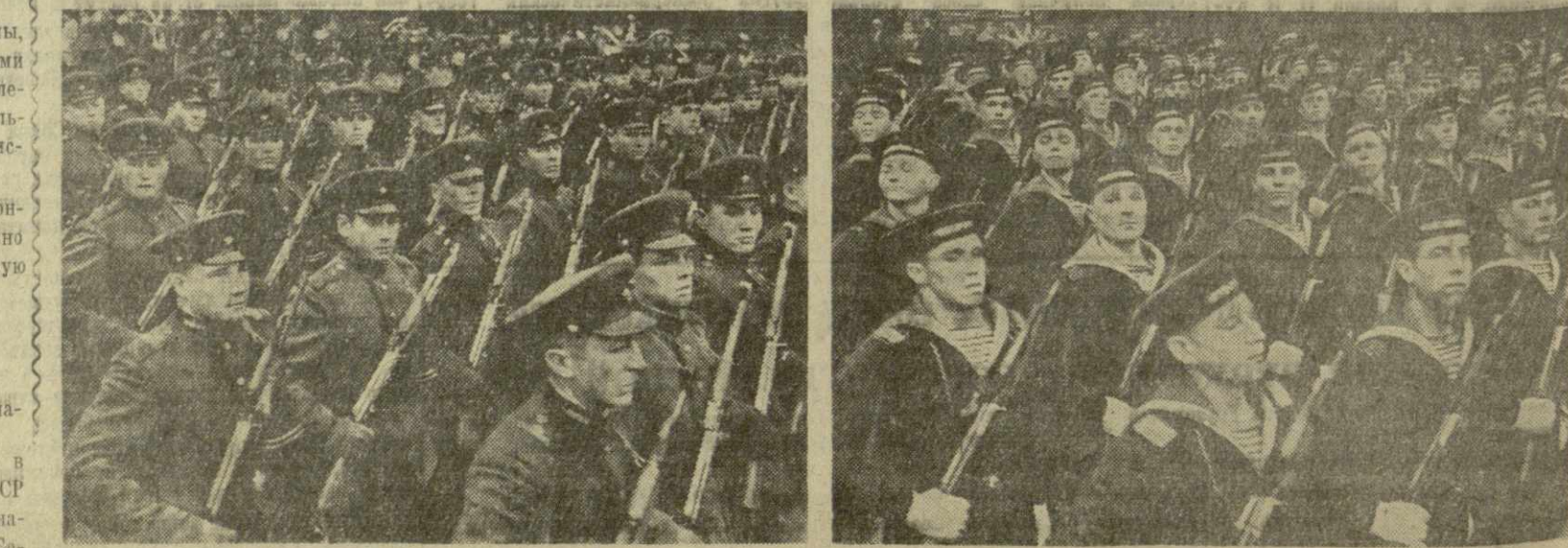
На снимках: парад войск Тбилисского гарнизона 7 ноября 1958 года.

Тепло приняли артисты выступление солиста Киевского театра оперы и балета имени Шевченко В. Того хора северной песни. Он исполнил северные песни и последовательные русские песни, а также яркое искус-