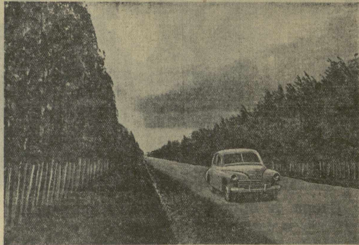
На снимке: ветрозащитные насаждения колхоза «Гамарджаба» села Каралети Горького района.