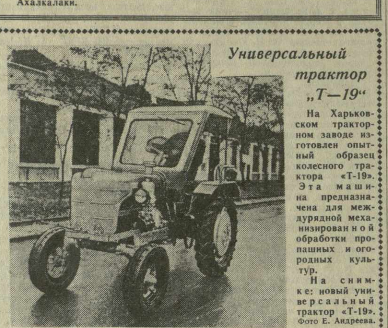
Универсальный трактор Т-19

Зональные совещания-семинары руководителей агитколлективов Отдел пропаганды и агитации ЦК КП Грузии провел в Тбилиси зональные совещания-семинары руководителей агитколлективов районов Восточной Грузии, посвященные вопросам усвоения агитмассовой работы в период подготовки к XXI съезду КПСС, обсуждению документов ноябрьского Пленума ЦК КПСС. Участники совещания поделились опытом агитмассовой работы, наметили пути улучшения руководства агитаторами. На совещаниях выступили с лекциями руководители партийных работников и лекторы высших учебных заведений Тбилиси. Зональные совещания-семинары руководителей агитколлективов также были проведены в Сухуми, Батуми, Сталинири, Кутаиси и Ахалкалаки.