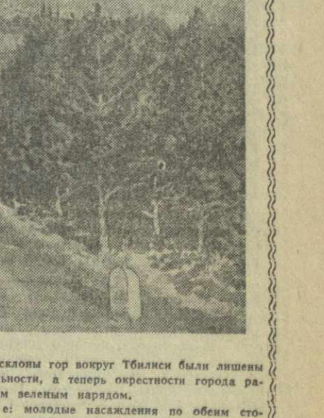
Еще недавно склоны гор вокруг Тбилиси были лишены всякой растительности, а теперь окрестности города радуют глаз своим зеленым нарядом.