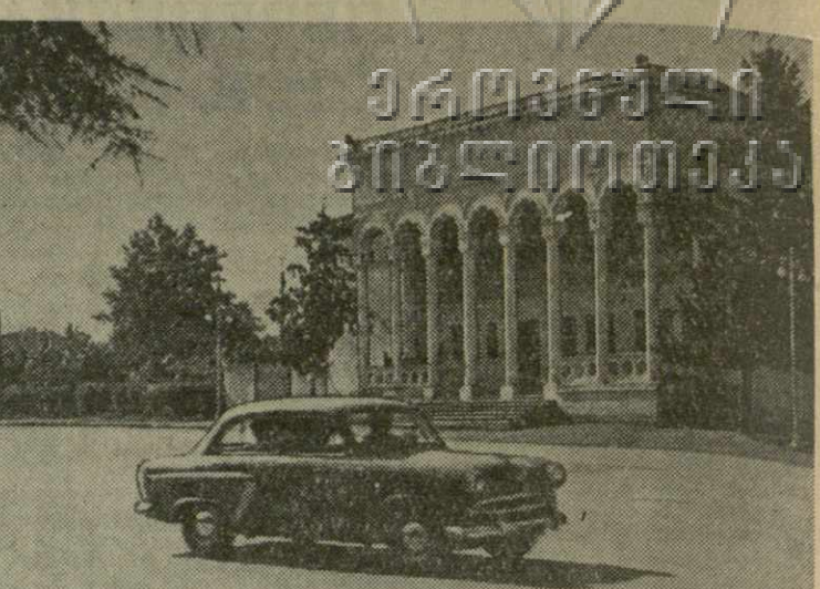
С каждым годом растут и хорошеют города нашей республики. Наряду с широко развитами жилищным строительством идет сооружение зданий для культурно-бытовых нужд населения. В эксплуатацию сдаются все новые и новые клубы, кинотеатры, дома культуры. И на снимке: вид на здание Ланчугатского Дома культуры.

С. СВЕРДЛИН, Д. ШЕЛИЯ. (Корр. «Заря Востока»).