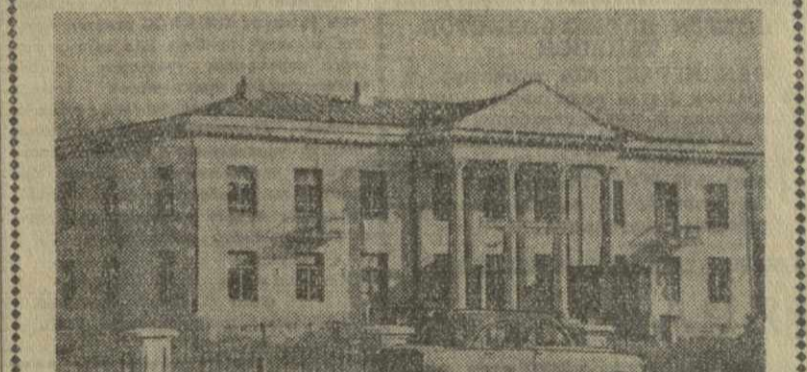
Гали. Окмская сельская больница получила новое двухэтажное здание. В нем оборудованы стоматологический, терапевтический и другие кабинеты. При больнице имеются родильное отделение и аптека. Сейчас в новой больнице оборудуют хирургическое отделение. На снимке: здание новой окмской сельской больницы.

И вот однажды и ему зашла на прием работница. Не случилась неприятность — во время дождя протекла крыша, и вода полилась