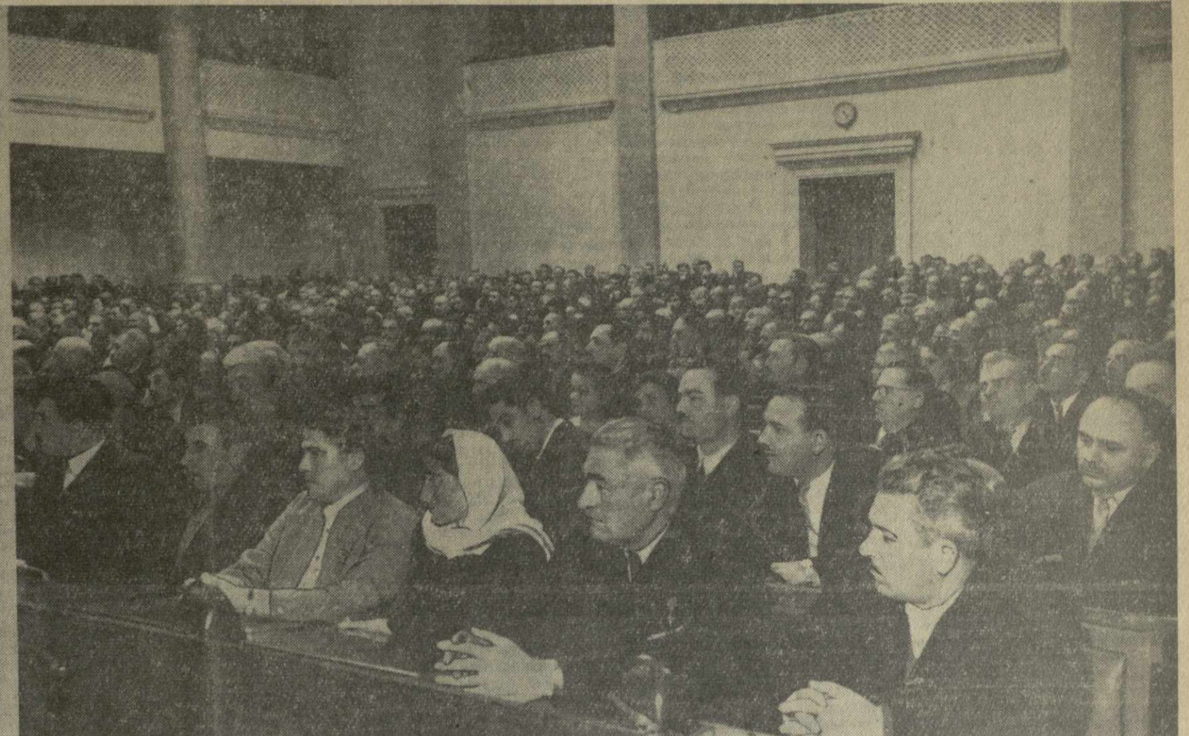
Митинг представителей трудящихся Грузинской ССР. На трибуне: кандидат в члены Президиума ЦК КПСС, первый секретарь ЦК КП Грузии В. П. Мжаванадзе.