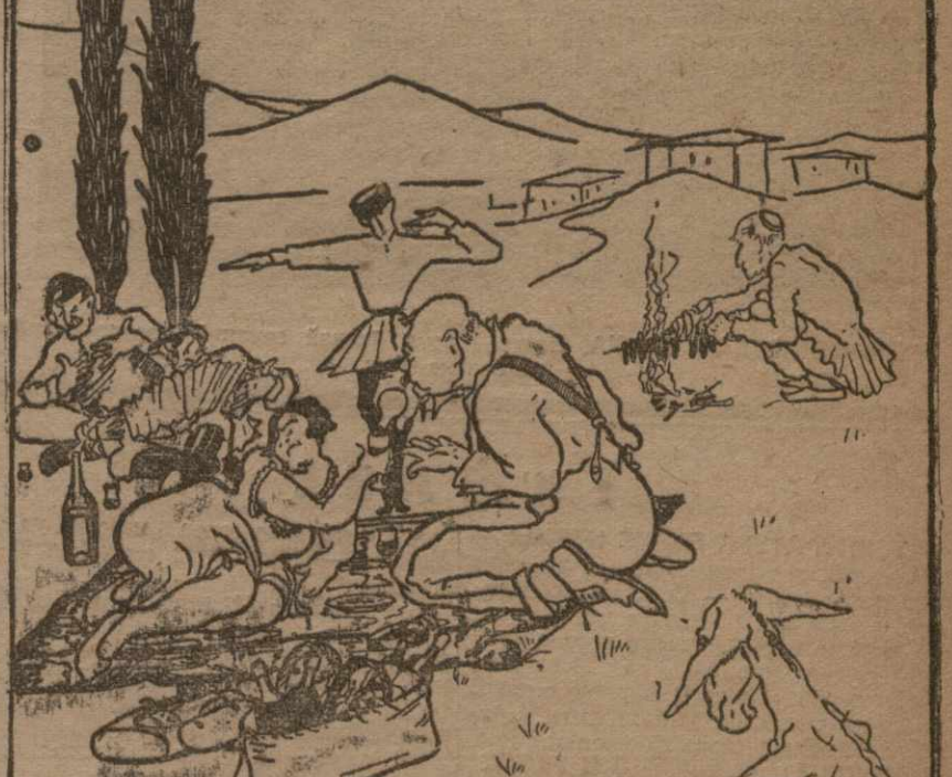
Рис. Б. Ром.

Вместо научно-популярных экскурсий у нас большую популярность приобретают так называемые „экскурсии“.