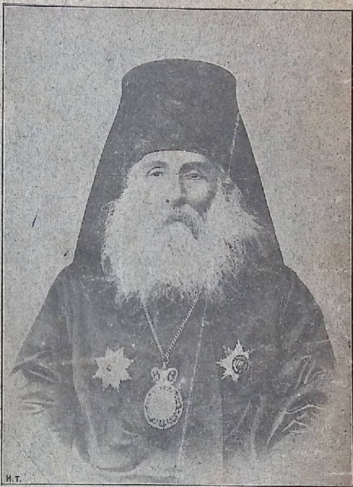
გამოცემული ზ. ჭიჭინაძისაგან

თფილისი მსწრაფლ-მბეჭდავი ა. ქუთათელაძისა, ნიკ. ქ., № 21. 1903