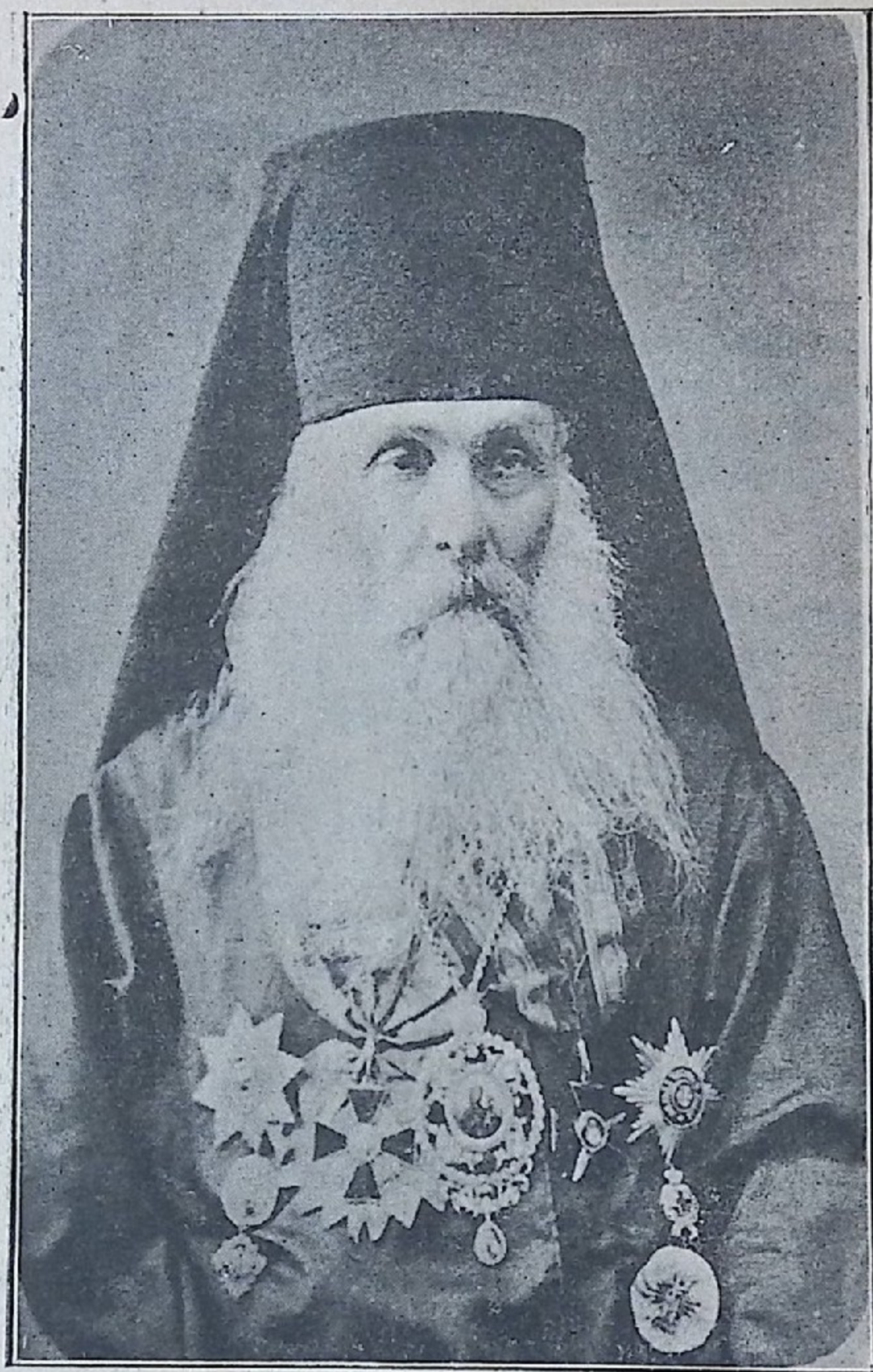
გურია-სამეგრელოს ეპისკოპოსი ყოვლად სამღვდელო ალექსანდრე.