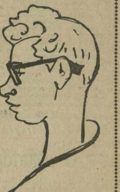
Е. ВАСЮКОВ. Дружеский шахр художника Р. Сачидана.

20. Kc3: e4 Jf6: e4 21. Jf1: e4 Kc5: e4 22. Fe2: e4. (В этот ранний момент партии Геллер уже стал ощущать недостаток времени. вполне возможно было 22. Jc1). 22... Fc7: c4 23. Fe4—f3 ... (После партии Таль отметил, что лучшим шансом на спасение был ход 23. Jf4! Следует отметить, что после 23. Fc4 Jf1: c4 24. c: d6 Jf4 и у белых худший эндшпиль).