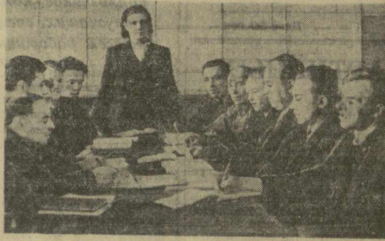
На снимке: занятие кружка по изучению отдельных произведений В. И. Ленина в цехе № 4 завода имени Козицкого.

Редакция рассчитывает на то, что наши пропагандистские кадры, работники партийных комитетов, домов и кабинетов политического просвещения подробно ознакомились с письмами ленинградских коммунистов и коллективно обсудят, что ценного и полезного для себя они смогут почерпнуть из опыта ленинградцев.