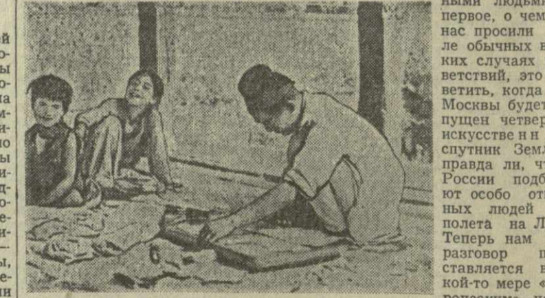
В Катманду удалось снять и такую сценку. Кроют и шить портному удобно прямо на земле.

и, чуть не задев крылом аэродромные постройки, посадил самолет. Это здесь считается особым шиком.