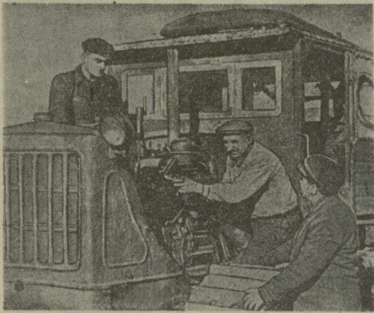
Колхозы сел Далласи, Цамгани, Чархали, Коприси и другие Мукетского района...