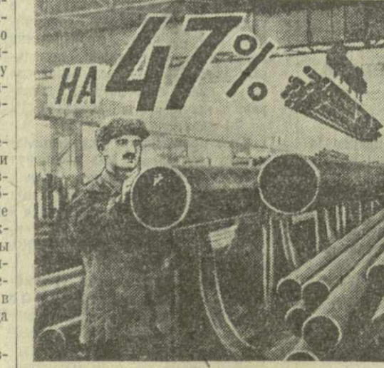
Таким будет рост производства стальных труб в Рустави за семилетие.

С целью лучшего использования резервов мартеновского производства особое внимание будет обращено на повышение стойкости печей, резкое сокращение простоев, улучшение качества и сокращение потерь металлов. В этом направлении намечено проводить большую работу, чтобы увеличить производство металла. Производство готового проката — крупного сорта, листа и мелкого сорта — за период 1959 — 1965 гг. возрастет на 23 — 25 процентов. Этот рост предусматривается в основном за счет реконструкции и модернизации прокатных станов, широкого внедрения механизации и автоматизации технологических процессов. Большую помощь руставским металлургам должны оказать горняки Дашкесанского рудоуправления. Совнархозу Азербайджанской ССР необходимо уделить серьезное внимание осуществлению проекта реконструкции и ремонту улучшению работы Дашкесанской обогатительной фабрики с целью глубокого обогащения железных руд, повышения содержания в сырье железа и увеличения выхода агломерационной руды.