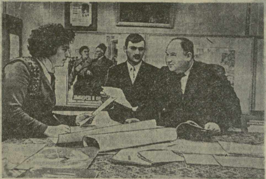
На снимке: агитаторы избирательного участка № 19 Калининского района города Тбилиси за выпуском очередного номера стеновой газеты «Голос избирателя».

ЗУГДИДИ. (Корр. «Заря Востока»). Трудящиеся района с глубоким интересом изучают исторические решения XXI съезда КПСС. Свыше 1.200 агитаторов проводят в колхозах и совхозах беседы и коллективные чтения газет, мобилизуют усилия трудящихся на успешное выполнение задач семилетнего плана. Активно участвуют в массово-политической и пропагандистской работе члены лекторской группы райкома партии. Силами лекторов