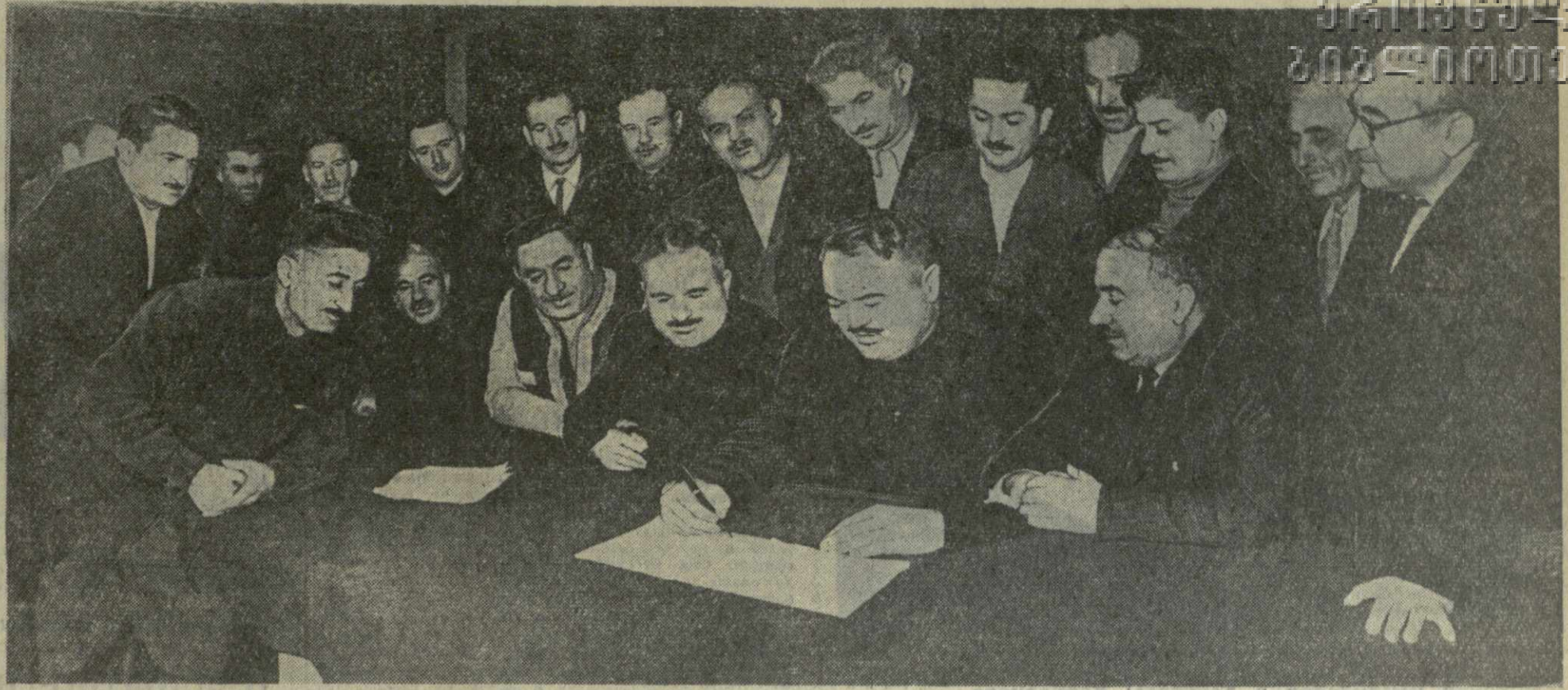
На снимке: участники совещания передовиков сельского хозяйства Цителцкарского района подписывают обращение.

Государственным издательством политической литературы выпущена в свет брошюра «Контрольные цифры развития народного хозяйства СССР на 1959 — 1965 годы», утвержденные XXI съездом КПСС. Брошюра издана миллионным тиражом.