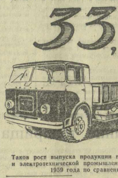
Таков рост выпуска продукции по Управлению машиностроительной и электротехнической промышленности Совнархоза Грузии в январе 1959 года по сравнению с январем 1958 года.

ны быстродействующие зажимные устройства, что сократило вспомогательное время станочников и подняло производительность их труда. Значительные работы по модернизации оборудования проведены на заводах — имени Кирова, шифровальных станков, автомобильном, им. 26 комиссаров и других. Немало проведено работ по механизации внутривзаводского транспорта. Так, на Густавском механическом заводе