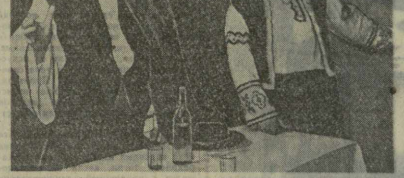
души, всю глубину своего чувства к погибшему.

С вокальной стороны хорошо удались артисты арии Катрены в жандлерии, на свадьбе, когда она оплакивает свой девичий венчик, и, особенно, в сцене над колыбелью сына. Проникновенно исполняет она и заключительную сцену признания.