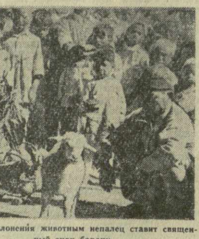
В День поклонения животным непалец ставит священный знак на лбу.

ку с рисом и с молитвой обходит храмы всех богов — жизни, смерти, любви, горю, веселью, счастья, несчастью, охоты, урожая, а также храм бога, носящего людей, посылая богам рисом, желая тем самым задобрить их. Рисом посыпается и то, что играет важную роль в жизни человека, — солнце, огонь, вода, луна. С раннего утра и до поздней ночи разбрасываются по всему Непалу пригоршни зерен. Подсчитано, что в этот день высыпается около 50 тонн риса.