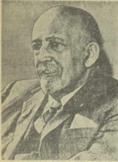
Уильям Эдуард Бургарт ДЮБУА — ученый, писатель, общественный деятель (США).