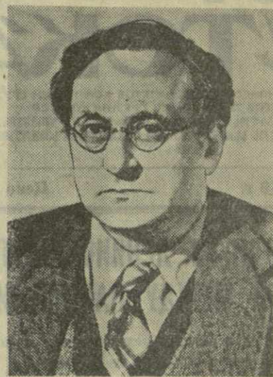
Айвор МОНТЕГЮ — публицист, член Бюро Всемирного Совета Мира (Англия).