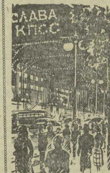
Предпраздничный Тбилиси всегда неповторим. Он каждый