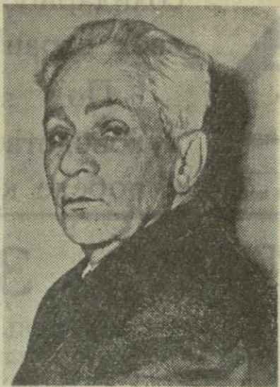
Костас ВАРНАЛИС — писатель (Греция).