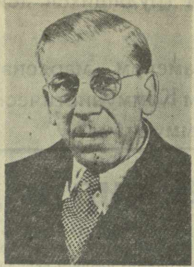
Отто БУХВИЦ — деятель немецкого рабочего движения (ГДР).