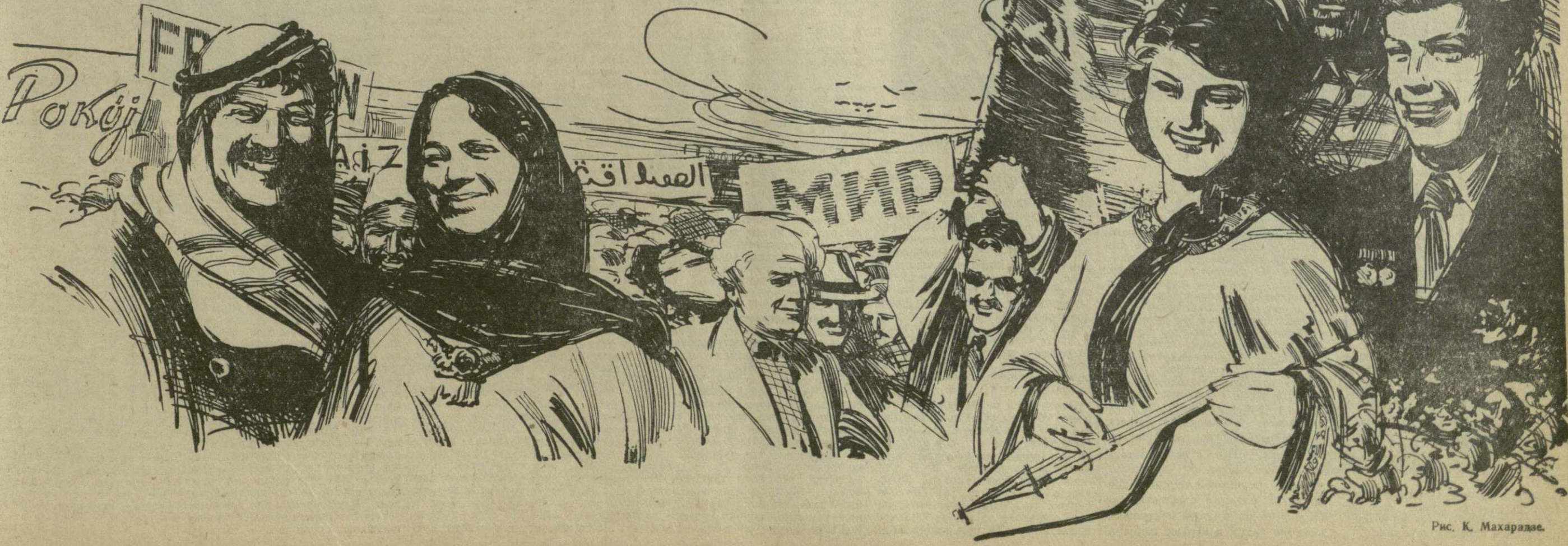
Рис. К. Махарадзе.

Министр обороны СССР Маршал Советского Союза Р. МАЛИНОВСКИЙ.