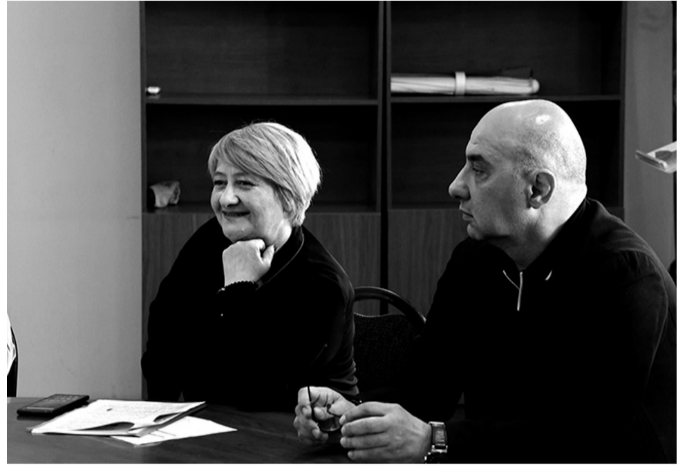
მოწყობა“. შესაბამისად, პროექტი დაფინანსდება ხაშურის მუნიციპალური ბიუჯეტიდან.

სათივეში ხმათა უმრავლესობა - 40 ხმა მიიღო პროექტმა „ჭაბურღილის