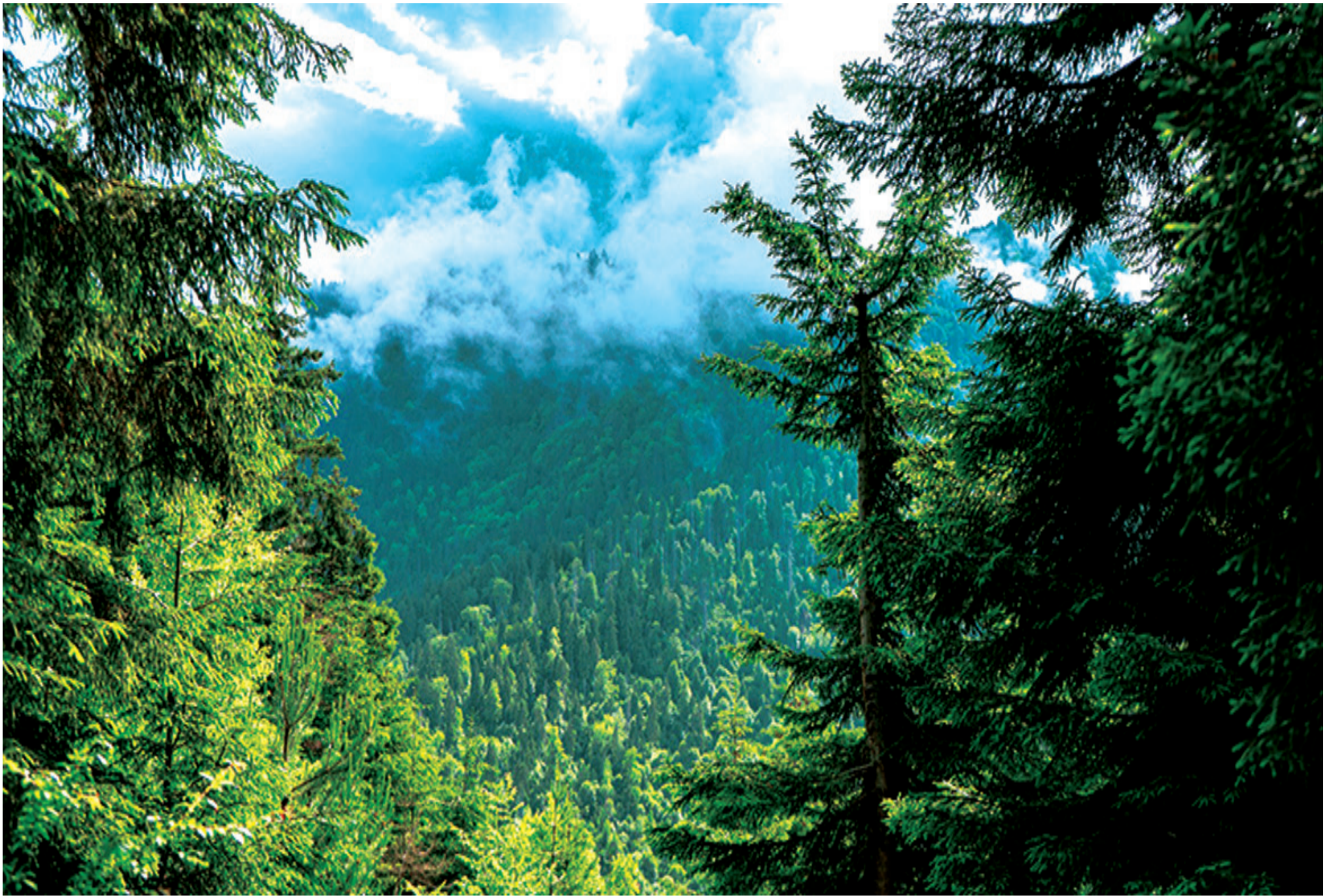
თრიალეთის ქედი, რომელიც ჩვენს ქალაქს სამხრეთიდან აკრავს, წელიწადის ნებისმიერ დროს ულამაზესია.