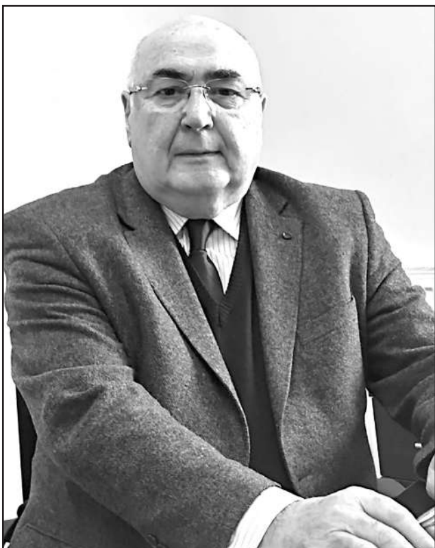
აკადემიკოსი რამაზ ხეცურიანი - 75

აკადემიკოსი რამაზ ხეცურიანი საერთაშორისო ავტორიტეტის მქონე მკვლევარია. მისი კვლევები მრავალადა ციტირებული როგორც ჩვენი ქვეყნის, ასევე მსოფლიოს მრავალი ქვეყნის სამედიცინო შრომებში. იგი არის 8 სახელმძღვანელო, 7 მონოგრაფიისა და 300-ზე მეტი სამეცნიერო ნაშრომის ავტორი, რომლებიც გამოცემულია როგორც მშობლიურ, ასევე სხვადასხვა უცხოურ ენაზე.