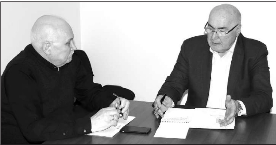
პროფესორი, რომლის ყოველი ლექცია სტუდენტთა გულწრფელი ტაშით მთავრდება

ჩვენ მიერ დადგენილი იქნა ერთობლივი სიცოცხლის ხანგრძლივობის და დეფორმაციის ხარისხის ცვალებადობის მორფოლოგიური თავისებურებები – ეს საკმაოდ მნიშვნელოვანი ფაქტია, რომელიც გვეხმარება ავსხნათ მოხუცებულობის ასაკში რა მიზეზით ვითარდება თავის ტვინის იშემიური ინსულტები.