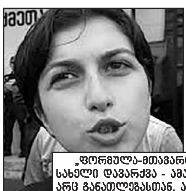
„ფორგულა-მთავარი-პირველი“ წარმოდგენილია პარასკევულ - არ ვიცი რა სახელი დაარქვა - ამგვარად გამოხდომას ახსოვსუბრად არაფერი აქვს საერთო არც განათლებასთან, არც უზრუნველყოფასთან, არც ქალბატონთან, არც ოჯახში გაზრდილობასთან და არც ადამიანობასთან.

რამ თქმა უნდა, პრემიერის ეს მიმართება უკომენტაროდ არ დაუტოვებია პარტია ხანა პარტიკულად ფიგურად აქვეუდ პრემიერისთვის. მართალია ვინა და საპარტიალოდ ისტორიის ყურადღებამათხრობდა არამცოდნე ამ ქალბატონმა ახალგაზრდობის ნაწილმა ცხად – ხალხი იმეორებდა, ახალგაზრდობა.